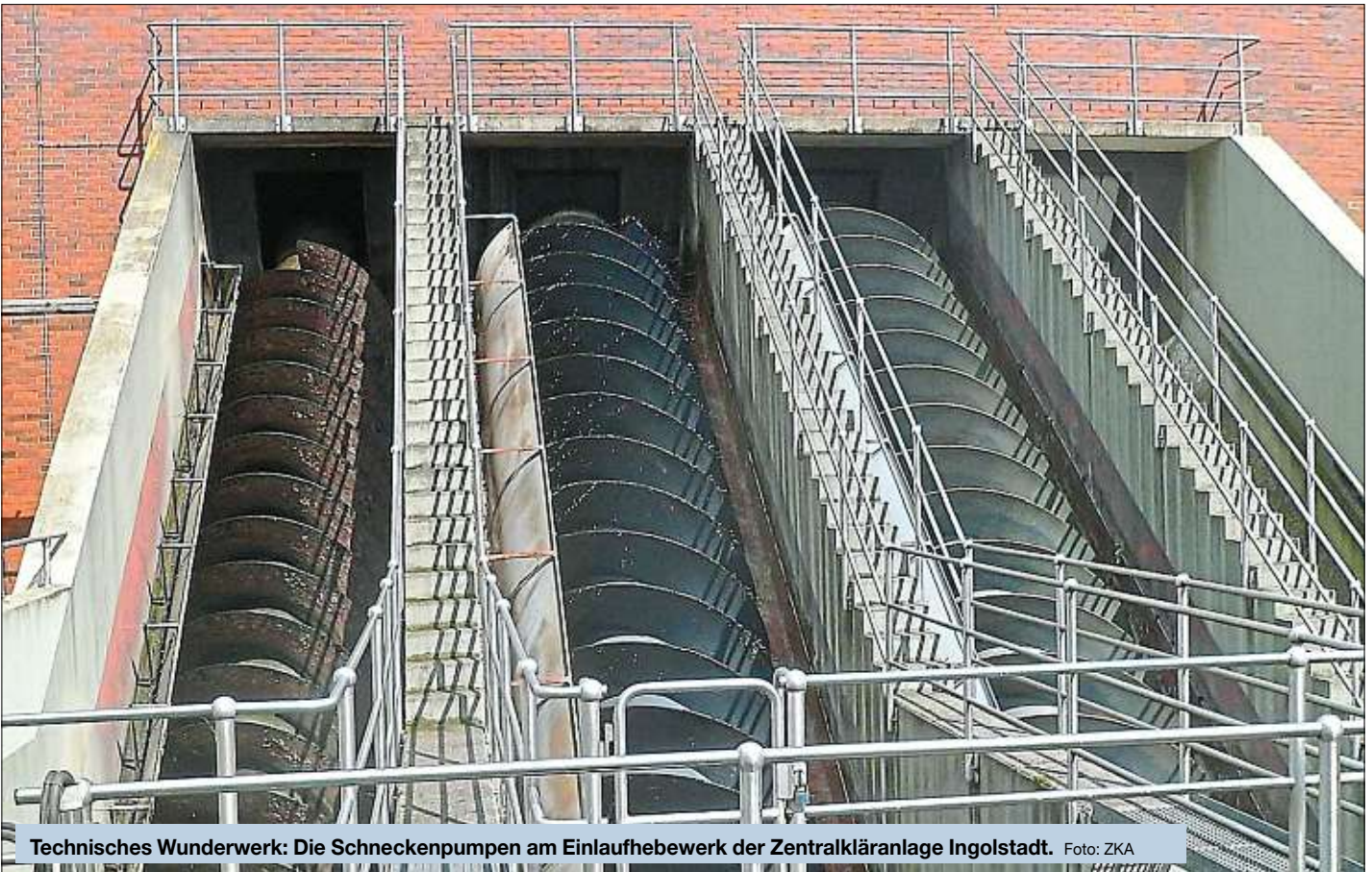
Technisches Wunderwerk: Die Schneckenpumpen am Einlaufhebewerk der Zentralkläranlage Ingolstadt.

Eine geniale Erfindung für die Abwassertechnik