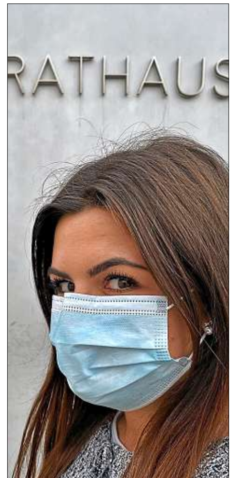
Vorsprachen im Rathaus sind derzeit nur mit Termin und Mund-Nasen-Schutz möglich.

ordnet bekommen haben und auch sonst keine grippalen Krankheitssymptome aufweisen. Besucher sind angehalten, bei ihrem Besuch in den Dienststellen der Stadtverwaltung einen Mund-Nasen-Schutz zu tragen. Eine ganze Reihe von Dienstleistungen bei der Stadt Ingolstadt kann ohne persönliche Vorsprache, online erledigt werden. Eine Übersicht über alle Online-Dienstleistungen ist hier zu finden: www.ingolstadt.de/online . Die Stadt bittet Bürger, vor einer persönlichen Vorsprache zu prüfen, ob die benötigte Dienstleistung nicht auch online erledigt werden kann.