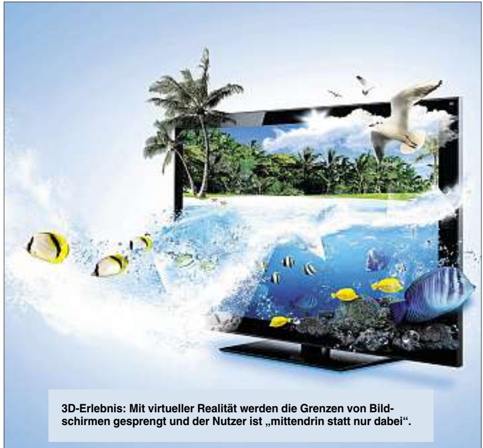
3D-Erlebnis: Mit virtueller Realität werden die Grenzen von Bildschirmen gesprengt und der Nutzer ist „mittendrin statt nur dabei“.

Damit klappt es dann auch mit dem Abtauchen in faszinierende virtuelle Welten, die große Datensätze erfordern. Damit kann man interaktive Filme oder besondere Orte beinahe so erleben, als wäre man selbst dabei – wie etwa in dem Eishotel am Polarkreis, das ein Touristikanbieter in seinem 3D-Portfolio bewirbt: Die Eisblöcke in dem igluartigen Bau sehen täuschend echt aus, man spürt beinahe die Kälte der eisigen Bar, auf der die Getränke bereitstehen – nur trinken kann man sie nicht.