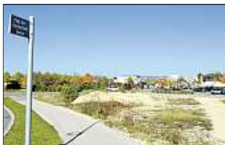
An der Furtwängler Straße/Stinnesstraße entsteht der Grasser Platz. Hierhin soll der Pius-Jugendtreff umziehen.

Das Raumprogramm entspricht den Empfehlungen des Bayerischen Jugendrings für eine Jugendfreizeitstätte. Entsprechende Fördermittel für den Neubau werden beim Bayerischen Jugendring und aus dem Programm Soziale Stadt beantragt. Erste Gespräche diesbezüglich verliefen positiv. Der jugendspezifische Schwerpunkt der künftigen Einrichtung, der sich an alle Jugendlichen stadtweit richten soll, wird vom Amt für Jugend und Familie noch gemeinsam mit dem Träger, den Mitarbeitern und den Jugendlichen sowie den weiteren Kooperationspartnern erarbeitet und festgelegt. Der Pius-Kindertreff soll hingegen künftig an der Christoph-Kolumbus-Grundschule angesiedelt werden. Die Schule wird gemäß dem aktuellen Schulentwicklungsplan einen rund 800 Quadratmeter großen Erweiterungsbau bekommen. Hierfür wurden vom Amt für Jugend und Familie rund 100 Quadratmeter für den Erweiterungsbau zusätzlich angemeldet, um lokal nach Auflösung des bisherigen Pius-Kindertreffs an der Waldeysenstraße Angebote der offenen Kinderarbeit direkt an der Schule anbieten zu können. Ein genauer Zeitplan für Neubau und Umzug existiert noch nicht, angepeilt sind aber die nächsten ein, zwei Jahre.