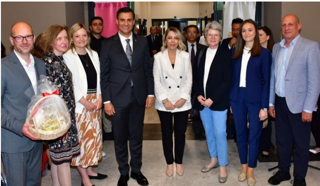
Empfang der Gäste durch Manisas Oberbürgermeister Ferdi Zeyrek (4.v.l.)

Mit den Verantwortlichen vor Ort wurde über die weitere Zusammenarbeit gesprochen, insbesondere über die Wiederaufnahme und Fortführung von Kontakten im sportlichen Kontext.