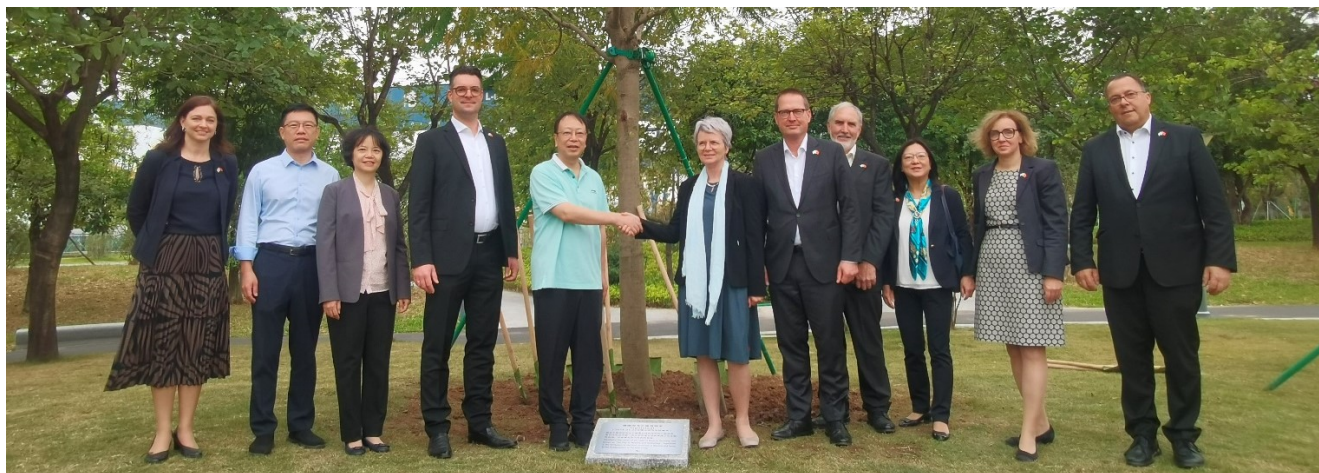
Delegation nach der Pflanzung des „Flammenbaums“

Die intensiven Gespräche zur weiteren Zusammenarbeit der beiden Städte trugen ebenfalls zur Pflege und Förderung der Kontakte bei.