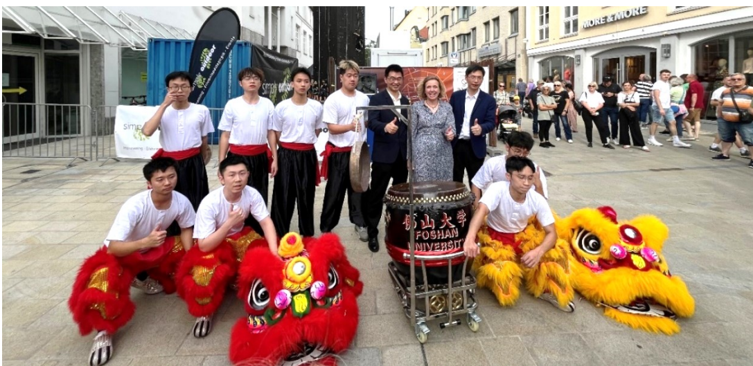
Löwentanzgruppe nach ihrem ersten Auftritt in der Ingolstädter Fußgängerzone

Eine Löwentanzgruppe aus der Partnerstadt Foshan bereicherte das Fest im Jahr des 10. Städtepartnerschaftsjubiläums mit chinesischer Folklore. Die ca. 10-minütigen Aufführungen fanden am 5. und 6. Juli in der Fußgängerzone, in der Ludwigstraße und der Theresienstraße statt.