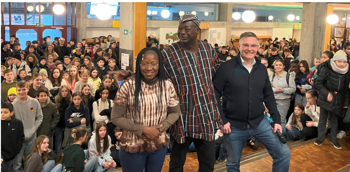
Besuch der Delegation am Katharinen-Gymnasium Ingolstadt

Von der Schulfamilie des Katharinen-Gymnasiums wurden die Gäste mit einem Konzert in der Aula herzlich empfangen und beantworteten die zahlreichen interessierten Fragen. Ein Besuch des Erste-Hilfe-Raums sowie ein Austausch mit der SMV und der Schülerzeitung zu Projekt und Partnerschaft standen ebenfalls auf dem Programm.