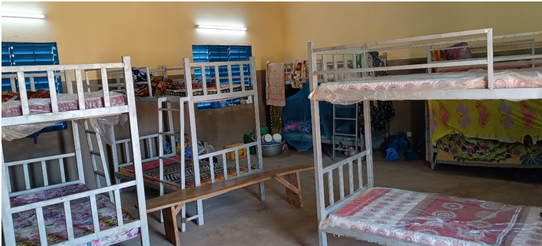
Mit Strom aus Photovoltaik und mit Doppelbetten ausgestattete Schlafräume im CAR

Auch die Arbeiten für die Photovoltaikanlage auf dem Dach des Schlafsaals liegen im Zeitplan. Für 2025 sind der Bau der Duschen und Toiletten sowie des Speisesaals vorgesehen. Die Eröffnung des Zentrums ist für Anfang 2026 geplant.