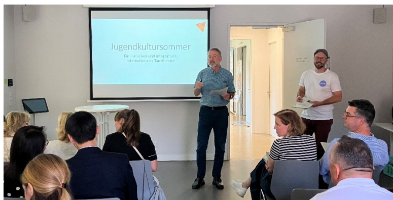
Vorstellung des Jugendkultursommers 2025 für die Delegationen

Im Jahr 2024 übernahm erstmals der Stadtjugendring die Trägerschaft des Jugendkultursommers und führte das Theaterprojekt zunächst ohne die Beteiligung der Partnerstädte durch. Für das Jahr 2025 ist eine Teilnahme von Jugendlichen aus den Partnerstädten wieder fest eingeplant. Im Rahmen einer Besprechung während des Bürgerfests stellte der Stadtjugendring den angereisten sieben Delegationen die künftige Durchführung des Projekts ab 2025 vor.