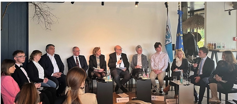
Teilnehmende an der Gesprächsrunde zum Europatag in Ingolstadt