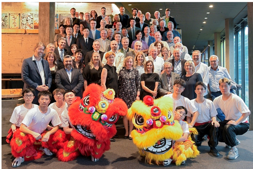
Gruppenfoto beim Empfang im Ingolstädter Stadttheater