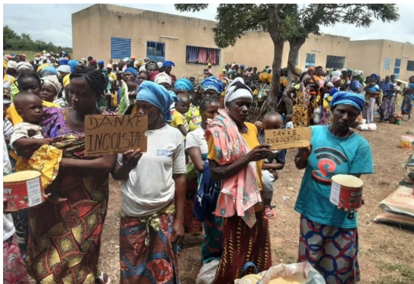
Getreideverteilung an die Bevölkerung in Legmoin

Zuletzt stellte die Stadt Ingolstadt im August 2024 einen Betrag von 20.000 Euro zur Verfügung, mit dem vor Ort dringend benötigte Lebensmittel wie Reis und Getreide für die unter einer akuten Hungersnot und Dürre leidende Bevölkerung gekauft wurden.