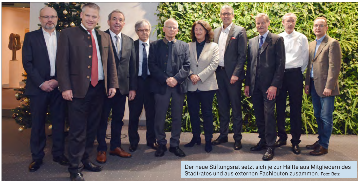
Der neue Stiftungsrat setzt sich je zur Hälfte aus Mitgliedern des Stadtrates und aus externen Fachleuten zusammen.

Veränderungen beim städtischen Altenheim Heilig-Geist-Spital beziehungsweise der Trägerstiftung: Bereits vor der Sommerpause hatte der Ingolstädter Stadtrat dem Vorhaben zugestimmt, einen Stiftungsrat für das Heilig-Geist-Spital einzurichten. Eine entsprechende Satzungsänderung wurde inzwischen durch die Stiftungsaufsicht genehmigt. Im Dezember kam der neue Stiftungsrat zu seiner konstituierenden Sitzung zusammen.