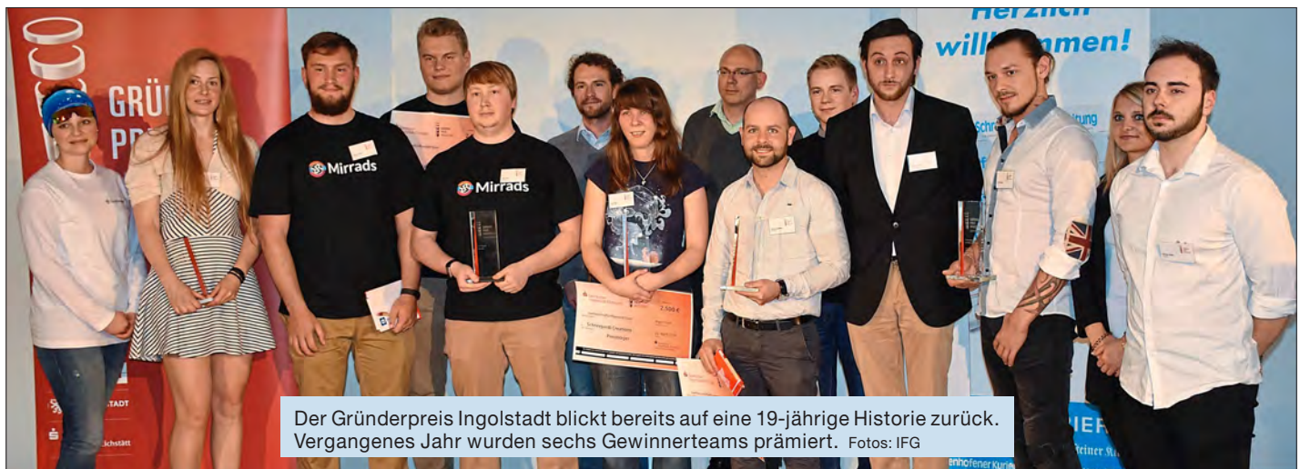
Der Gründerpreis Ingolstadt blickt bereits auf eine 19-jährige Historie zurück. Vergangenes Jahr wurden sechs Gewinnerteams prämiert.

Jungunternehmer und Unternehmensnachfolger eifern um Gewinn von 10 000 Euro