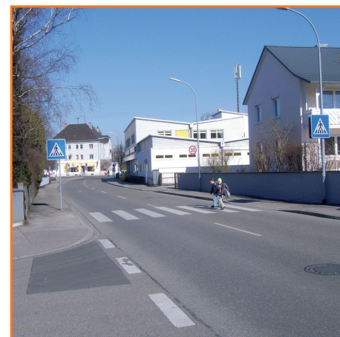
Fußgängerüberweg in der Klein-Salvator-Str. und Erletstr.