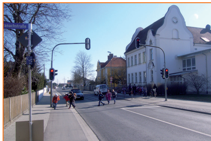
Fußgängerampel in der Geisenfelder Straße