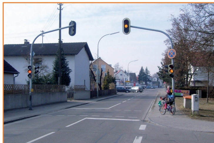
Fußgängerampel in der Weicheringer Straße