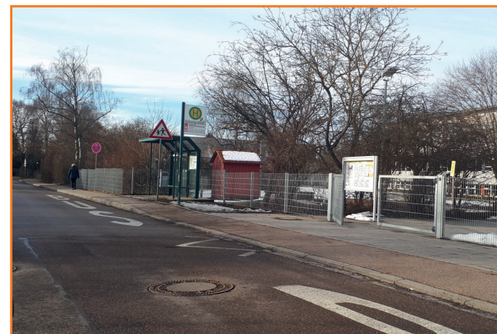
Bushaltestelle „Zuchering Schule“