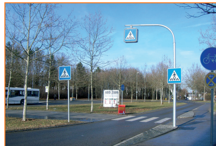
Fußgängerüberweg in der Krumenauerstraße