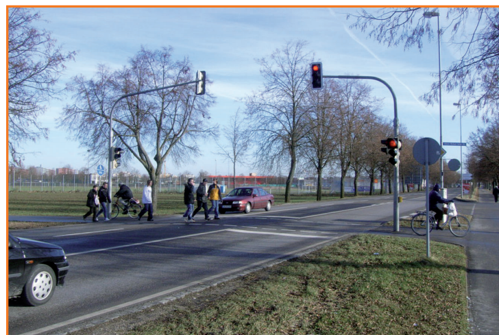
Fußgängerampel in der Neuburger Straße