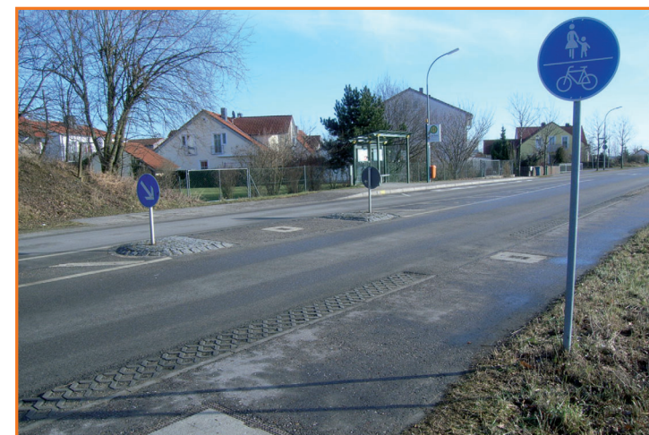
Querungshilfe in der Hofmarkstraße