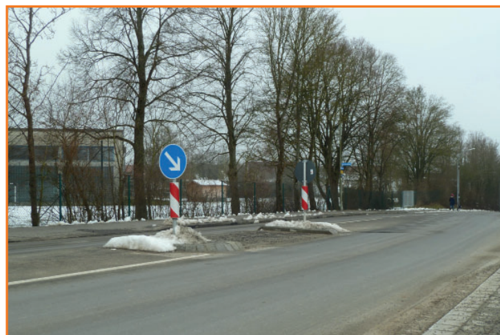
Querungshilfe in der Dreiländerstraße