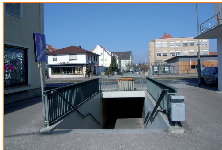
Fußgängerunterführung in der Goethestraße