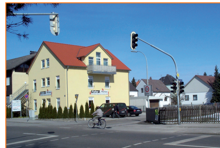
Fußgängerampel in der Schillerstraße