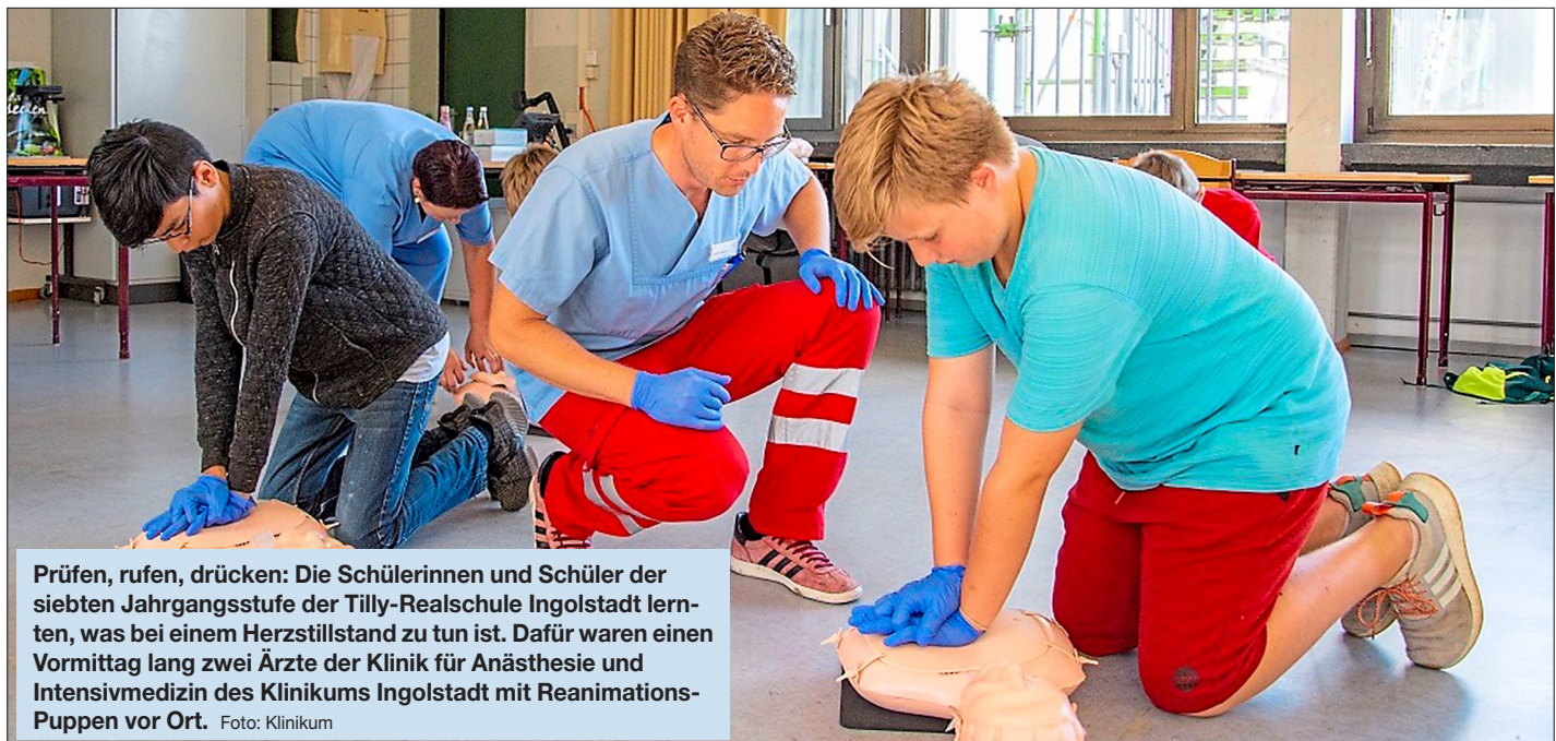
Prüfen, rufen, drücken: Die Schülerinnen und Schüler der siebten Jahrgangsstufe der Tilly-Realschule Ingolstadt lernen, was bei einem Herzstillstand zu tun ist. Dafür waren einen Vormittag lang zwei Ärzte der Klinik für Anästhesie und Intensivmedizin des Klinikums Ingolstadt mit Reanimations-Puppen vor Ort.

Ärzteteam des Klinikums bietet Wiederbelebungstraining für Schulklassen an