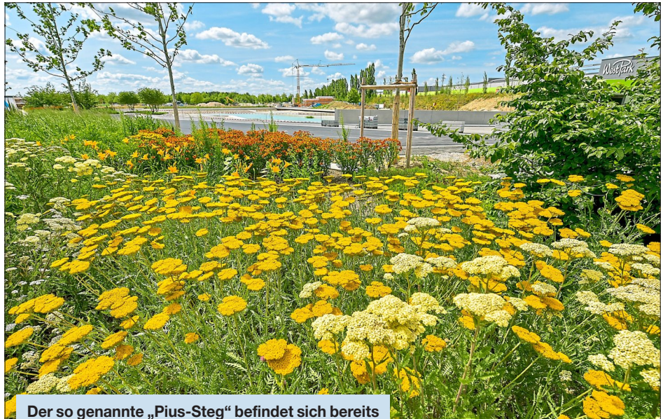
Der so genannte „Pius-Steg“ befindet sich bereits im Bau und auch die ersten Blumen sprießen auf dem LGS-Gelände schon.

Auf rund 50 Demonstrationparzellen wachsen viele unterschiedliche Nahrungs-, Futter- und Gewürzpflanzen, vom Inkarnat-Klee über Winter-Emmer und Weiße Lupine bis zur Esparsette. Auf einer zweiten Fläche wird eine typische Fruchtfolge mit sieben verschiedenen Kulturarten gezeigt. Hier