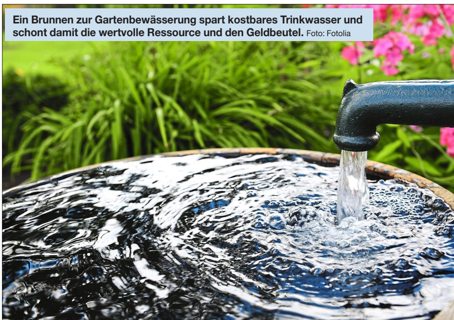
Ein Brunnen zur Gartenbewässerung spart kostbares Trinkwasser und schont damit die wertvolle Ressource und den Geldbeutel.

Trinkwasser ist ein kostbares Gut, das es zu schützen gilt. Der Schutz der Wasserressourcen sichert langfristig und nachhaltig die Trinkwasserversorgung. Darum kümmern sich in Ingolstadt die Kommunalbetriebe.