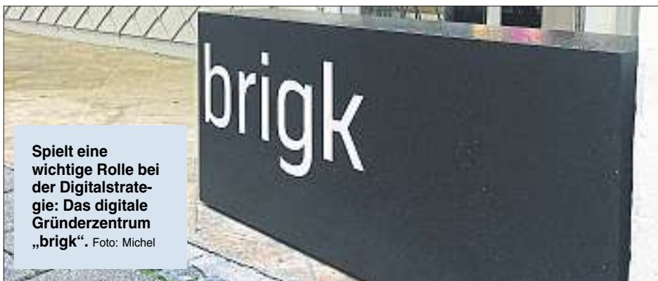
Spielt eine wichtige Rolle bei der Digitalstrategie: Das digitale Gründerzentrum „brigk“.