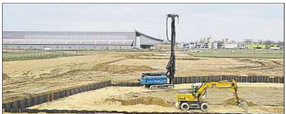
Mit Spezialfahrzeugen werden Metallbohlen im Bereich des künftigen Sees in den Boden gerammt.

Bis zum Beginn der Landesgartenschau ist das Gartenamt aber nicht nur auf dem LGS-Gelände aktiv. Vielmehr wird in der ganzen Stadt fleißig gearbeitet. 2015 hat sich das Gartenamt nämlich das Ziel gesetzt, bis zum LGS-Start 2020 etwa ebenso viele neue Bäume in der Stadt zu pflanzen. Damit wird nicht nur das Stadtbild verschönert, sondern auch das Stadtklima verbessert. Jetzt, zur Halbzeit, sind bereits rund 1100 Bäume neu angepflanzt worden. Ersatzpflanzungen zum Austausch kranker Bäume sind von dieser Berechnung natürlich ausgenommen. Rund die Hälfte der Bäume wurden entlang von Straßen gepflanzt, weitere 250 in Parks, Grünzügen und Naherholungsgebieten, 170 auf Ausgleichsflächen. Die anderen neuen Bäume stehen auf Friedhöfen, auf Spiel- und Sportplätzen und sonstigen Standorten. Der Großteil der Neupflanzungen – rund 60 Prozent – erfolgte in den vier Bezirken Friedrichshofen, Süd, Südost und West und dort im Wesentlichen in den Neubaugebieten. Die übrigen 40 Prozent verteilen sich recht gleichmäßig auf die anderen Stadtgebiete. Am häufigsten gepflanzt wurden Ahorn-Arten, Hainbuchen, Linden, Platanen und Obstgehölze.