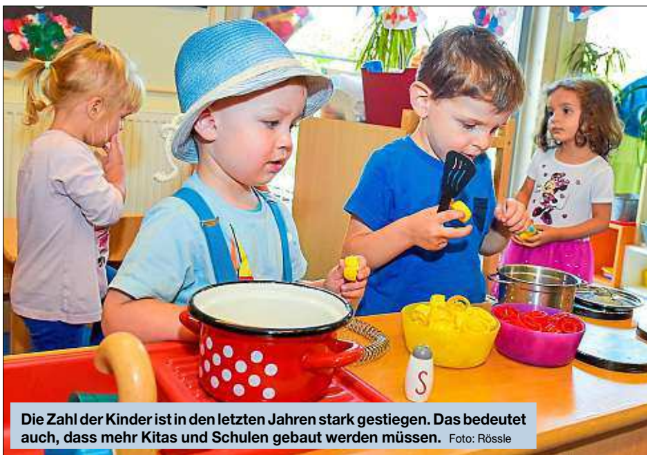
Die Zahl der Kinder ist in den letzten Jahren stark gestiegen. Das bedeutet auch, dass mehr Kitas und Schulen gebaut werden müssen.