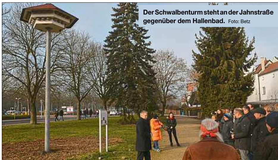
Der Schwalbenturm steht an der Jahnstraße gegenüber dem Hallenbad.

Als Ausgleichsmaßnahme für das Bauprojekt „IN-Tower“ am Nordbahnhof hat die bauausführende Firma die Kosten des Schwalbenturms gegenüber dem Hallenbads vollständig übernommen. Für die Idee und Umsetzung waren das Umweltamt der Stadt Ingolstadt und der Landesbund für Vogelschutz (LBV) verantwortlich. Der Turm soll Mehlschalben und Spatzen Brutraum bieten und auch Fledermäuse können hier Unterschlupf finden. Mit der Anlage einer Blumenwiese durch das Gartenamt wurde der Lebensraum weiter aufgewertet. Eine Tafel informiert seit dem vergangenen Jahr zudem über das Projekt und seine wichtige Bedeutung für den Erhalt von Brutmöglichkeiten. Das Potenzial an Vögeln ist vorhanden. Um diese nun gezielt an den Schwalbenturm anzulocken, wurde jetzt vom Umweltamt mit Geldern aus dem Naturschutzfonds eine Klangattrappe angeschafft, die in Kürze von den Ehrenamtlichen des LBV installiert wird.