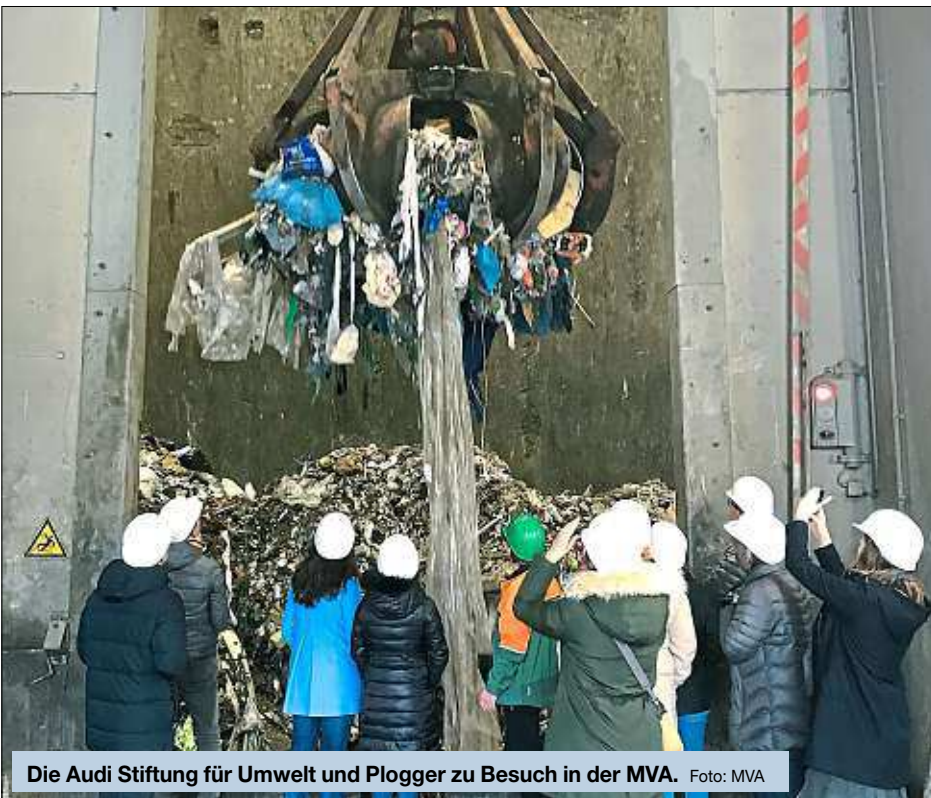
Die Audi Stiftung für Umwelt und Plogger zu Besuch in der MVA.

Das kennt sicher jeder: Müll liegt überall rum. Egal ob in der Innenstadt die Kaffee To-go-Becher oder am Straßenrand die Tüten von bekannten Fastfoodläden, ebenso wie achtlos weggeworfene Zigarettenstummel und leere Plastikflaschen. Selbst beim Spazieren durch Wald und Wiesen sind die Spuren der Umweltverschmutzung zu finden. Um dem entgegen zu wirken, haben die Ingolstädter Kommunalbetriebe vor Jahren die Aktion „Ramadama“ ins Leben gerufen und damit auch großen Erfolg. Jährlich werden durch die Aktion Rekordmengen von bis zu 23,5 Tonnen Müll aus Parks, Straßenrändern, den Donauauen etcetera gezogen und der Kreislaufwirtschaft wieder zugeführt.