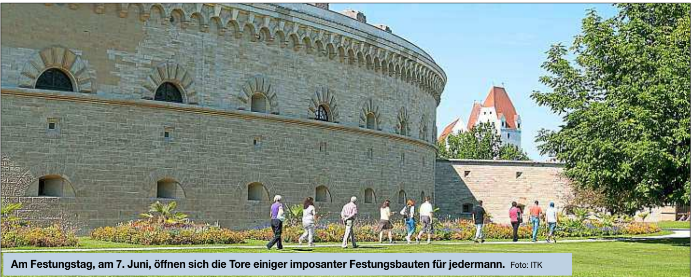
Am Festungstag, am 7. Juni, öffnen sich die Tore einiger imposanter Festungsbauten für jedermann.

Gästeführungen 2020 bieten zahlreiche Überraschungen