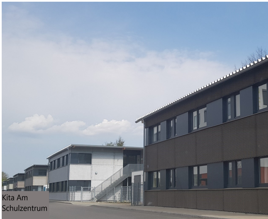
Abbildung 1: Kita Am Schulzentrum, Sturm Katharina, 2022