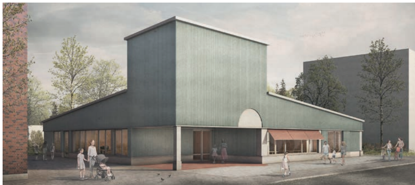
So wird der neue Stadtteiltreff einmal aussehen – hier der Eingangsbereich an der Stollstraße