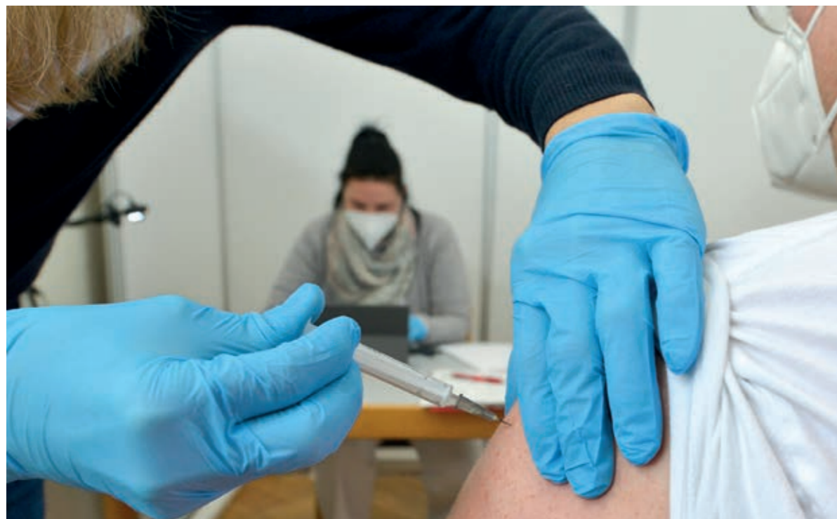
Durch Impfen kann die Pandemie überwunden werden

Gehörlose können sich per E-Mail an covid-deaf@ingolstadt.de wenden.