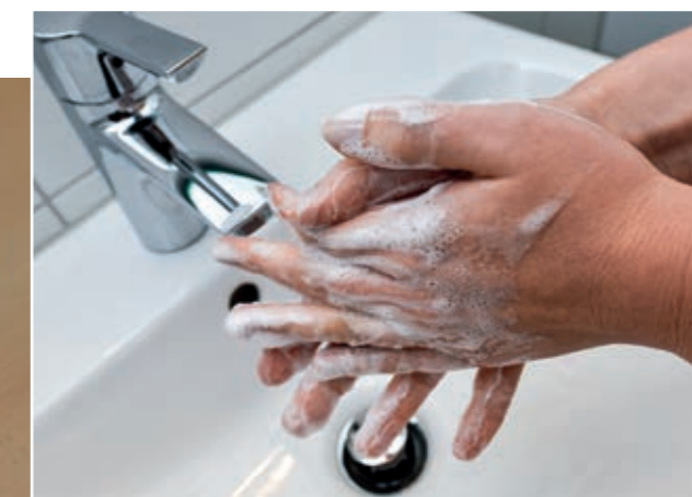
Häufiges Händewaschen beugt Infektionen vor