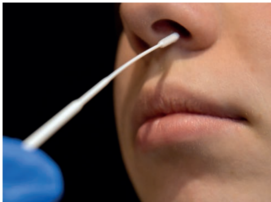
An vielen Stellen in der Stadt werden Schnelltests durchgeführt

Глухие люди могут обращаться с вопросами по электронной почте covid-deaf@ingolstadt.de