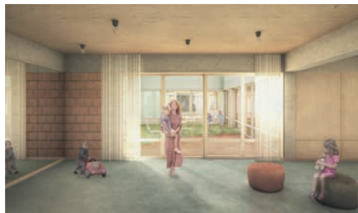
Ansicht des Multifunktionsraums

Geplant ist ein ebenerdiger Bau mit verschiedenen Nutzungsmöglichkeiten, der den vielfältigen Anforderungen und dem Platzbedarf gerecht wird. Neben zwei Seminarräumen wird es einen Multifunktions- und einen Beratungsraum geben. Zwischen den beiden Seminarräumen befindet sich eine Trennwand, die bei Bedarf geöffnet werden kann und die beiden Räume zu einem großen Saal vereint. Der Multifunktions- bzw. Bewegungsraum soll insbesondere für Aktivitäten mit Kindern und Erwachsenen genutzt werden, etwa für Sport- und Bewegungskurse. Ein Werkstattraum für handwerkliche Projekte ergänzt den Stadtteiltreff.