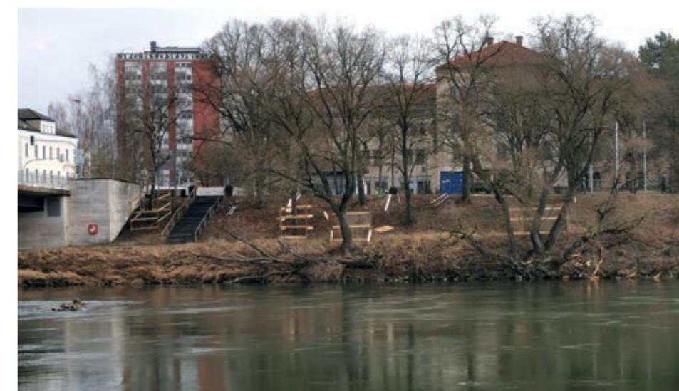
An der Konrad-Adenauer-Brücke wird gerade eine Sitzstufenanlage gebaut