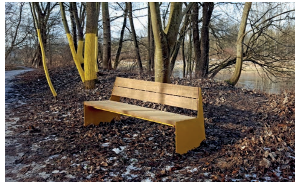
Solche Bänke sollen bald überall am Donaurundweg – dem Donau-Loop – stehen