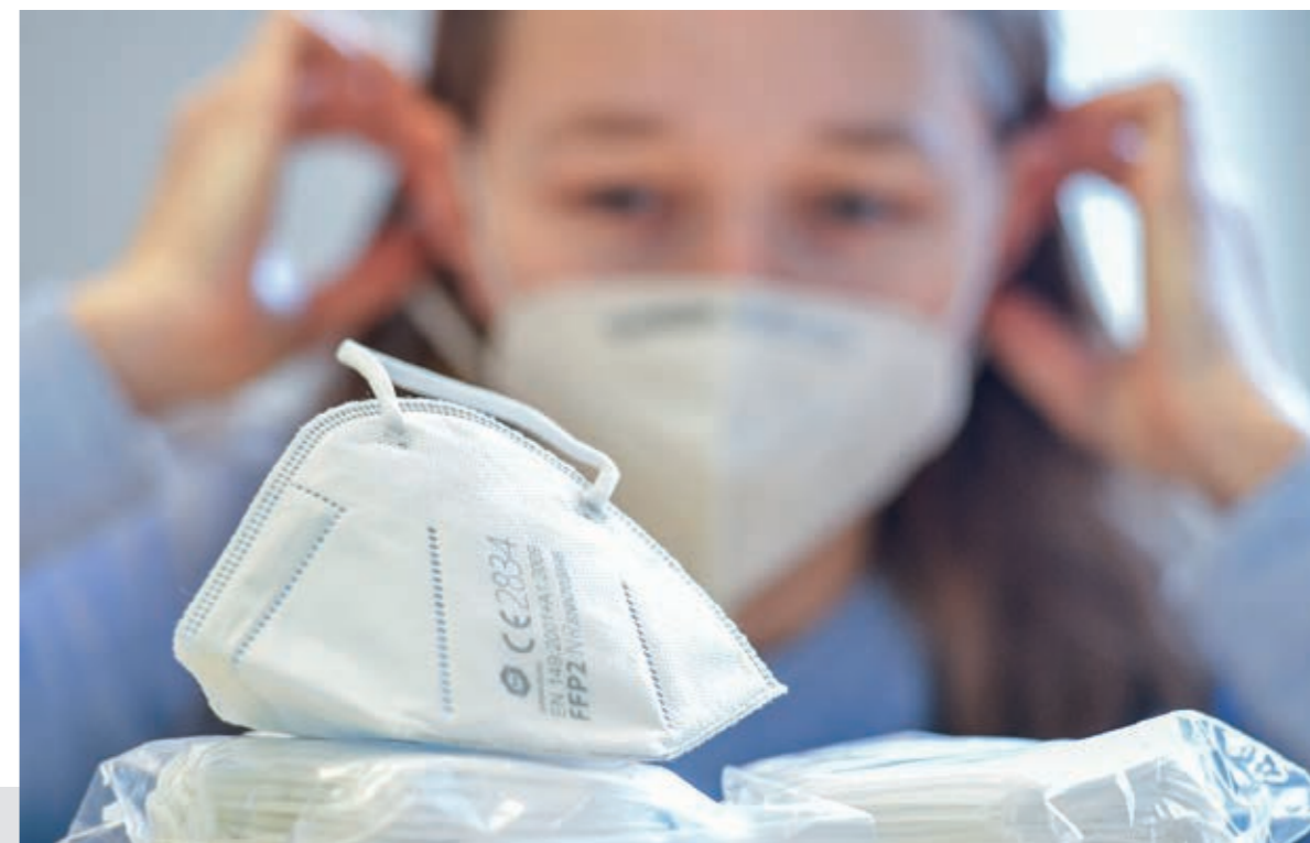
FFP2-Masken schützen vor Ansteckung

İşitme engelli vatandaşlarımız da covid-deaf@ingolstadt.de adresine e-posta yoluyla ulaşabilirler.