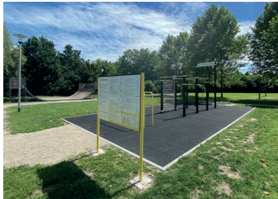
Der Spielpark Südost bietet verschiedene Freizeitmöglichkeiten: Die „Turnhalle im Freien“, die Calisthenics Anlage (s. oben), ein Fußballfeld, ein Volleyball- und ein Basketballfeld sowie eine Skaterbahn

Viele Maßnahmen des BZA dienen der Attraktivitätssteigerung unseres Stadtbezirkes. So wurde der Blechzaun des ESV mit historischen, großflächigen Fotografien verschönert; immer wieder sieht man Passanten die Bilder betrachten. Zum hundertsten Jubiläum der Freien Turnerschaft wurde die dringend notwendige Fassadenrenovierung bezuschusst, das leuchtende Blau ist jetzt schon von weitem zu erkennen. Für beide Vereine wurden moderne Turnmatten, sogenannte Airtrack-Matten angeschafft, die vor allem im Kinderturnen eingesetzt werden.