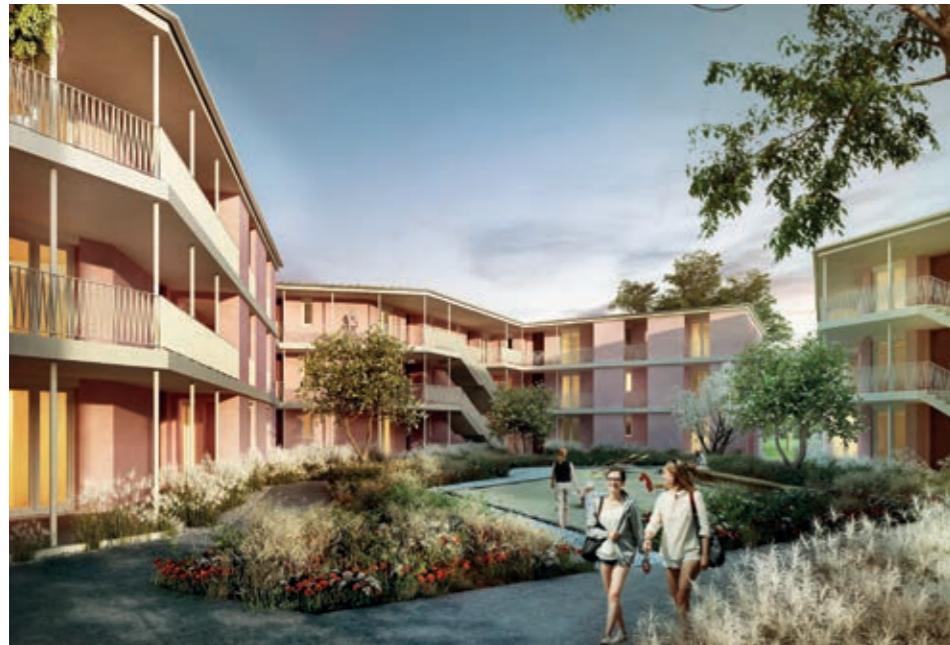
Im sog. Rosengarten in Oberhaunstadt gibt es bald einen weiteren Familienstützpunkt