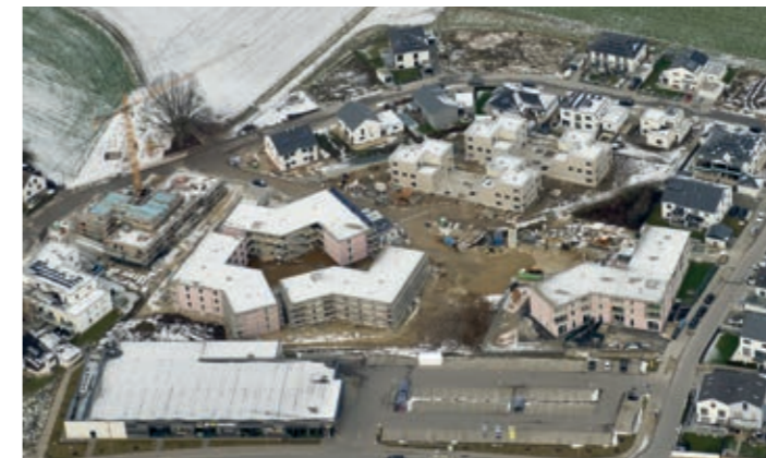
Das Quartier Rosengarten in Oberhaunstadt

Nachdem wir die letzten zwei Jahre sehr froh sind, dass wieder Normalität in den Familienstützpunkt zurückkehrt, sind wir besonders dankbar für offene Angebote, die nun wieder ohne Anmeldung besucht werden können. So auch das Familiencafé, das seit April nicht mehr in den Räumlichkeiten des Stadteiltreffs stattfindet, sondern auf dem Spielplatz (in der Nähe des Familienstützpunktes) in der Gerhart-Hauptmann-Straße verlegt wurde. Immer montags von 15 bis 17 Uhr sind die Familien zum „Familiencafé unterwegs“ eingeladen. Die Kinder können an einem Bastelangebot teilnehmen oder sich Spielgeräte aus dem Bollerwagen ausleihen. Den Eltern stehen Simone Werner vom Familienstützpunkt und Elisabeth Charatsaris vom Quartiersmanagement Konradviertel für Fragen und Anregungen zur Verfügung. Alle aktuellen Angebote und freien Plätze in den Spielgruppen, können telefonisch unter 0841 14900794 erfragt werden.