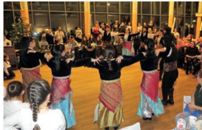
Feier zum griechischen Neujahrsfest

Der „Griechisch-Deutsche Kulturverein für Ingolstadt und Umgebung e. V.“ besteht seit April 2015. Zu unseren zweihundert Mitgliedern zählen nach Deutschland gezogene Griechinnen und Griechen, genauso wie Griechenland-Fans aus Deutschland. Der Verein hat sich den kulturellen Austausch zum Ziel gesetzt. Zum einen geht es darum, die kulturelle Identität der gebürtigen Griechinnen und Griechen am Leben zu erhalten und weiterzugeben, etwa durch griechische Tanzgruppen und Sprachunterricht. Zum anderen soll natürlich das Verständnis für die deutsche Kultur gefördert werden. Die Corona-Pandemie hat auch unseren Verein stark getroffen. Die Unterrichtsstunden für Sprache und Tanz und mussten gestoppt werden. Keine Vereinsfeste, keine Treffen und auch