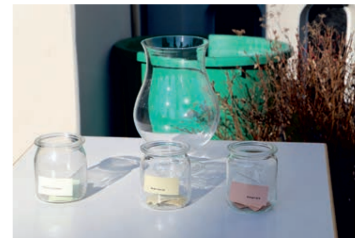
Gang zur „Urne“