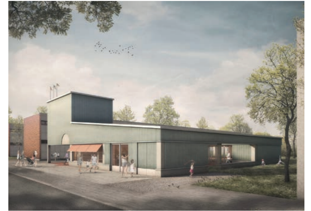
Noch ist der neue Stadtteiltreff eine Baustelle (links), aber nicht mehr lange, und er wird so aussehen wie oben