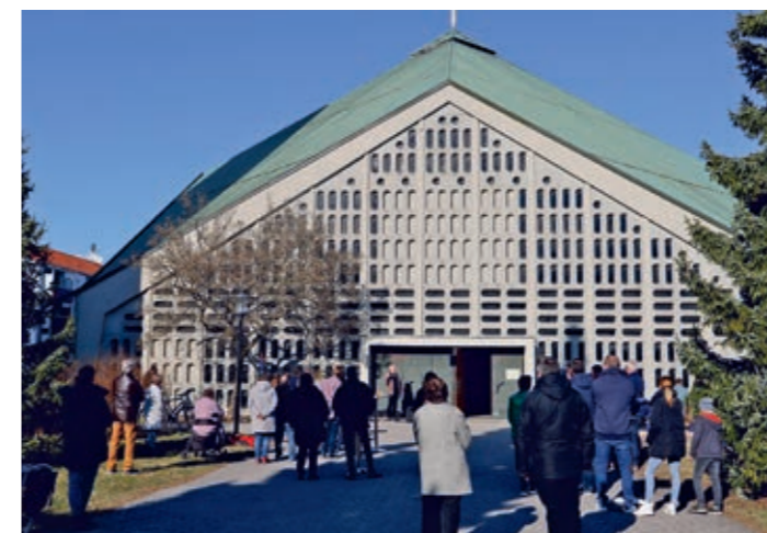
Kirche St. Augustin