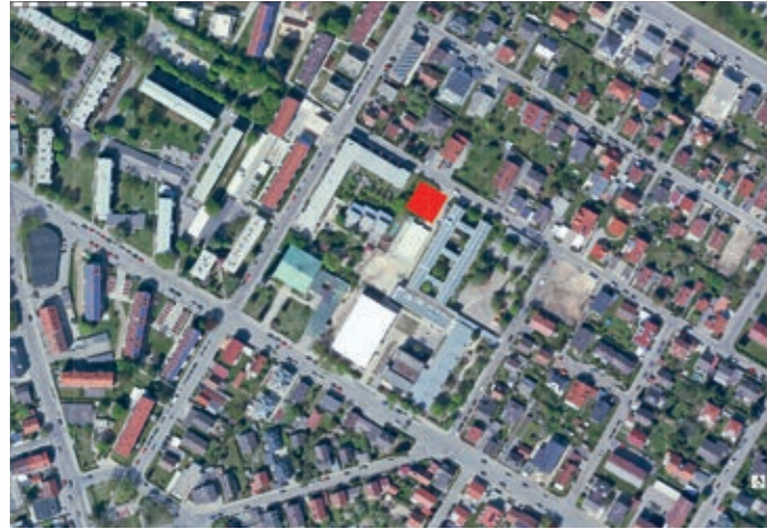
Hier wächst gerade der neue Stadtteiltreff in die Höhe

rechten Wohnanlage der Gemeinnützigen Wohnungsbaugesellschaft – derzeit im Zeitplan liegt und voraussichtlich im Herbst fertiggestellt werden kann. Nach dem Umzug steht uns ein etwa 80 Quadratmeter großer Veranstaltungsraum zur Verfügung, den wir in zwei einzelne Räume aufteilen können, wenn kleinere Gruppen da sind. Weiter gibt es im neuen Treff einen Spiel- und Bewegungsraum, in dem sich die kleinsten Besucher in ihrer Spielgruppe austoben können. Sport-, Bewegungs- und Entspannungsangebote in Kleingruppen sind dort genauso möglich. Die kleine Werkstatt lässt sich im Sommer zum Gehweg und zum Innenhof hin öffnen, so dass alle Handwerker/-innen an der frischen Luft schrauben und basteln können.