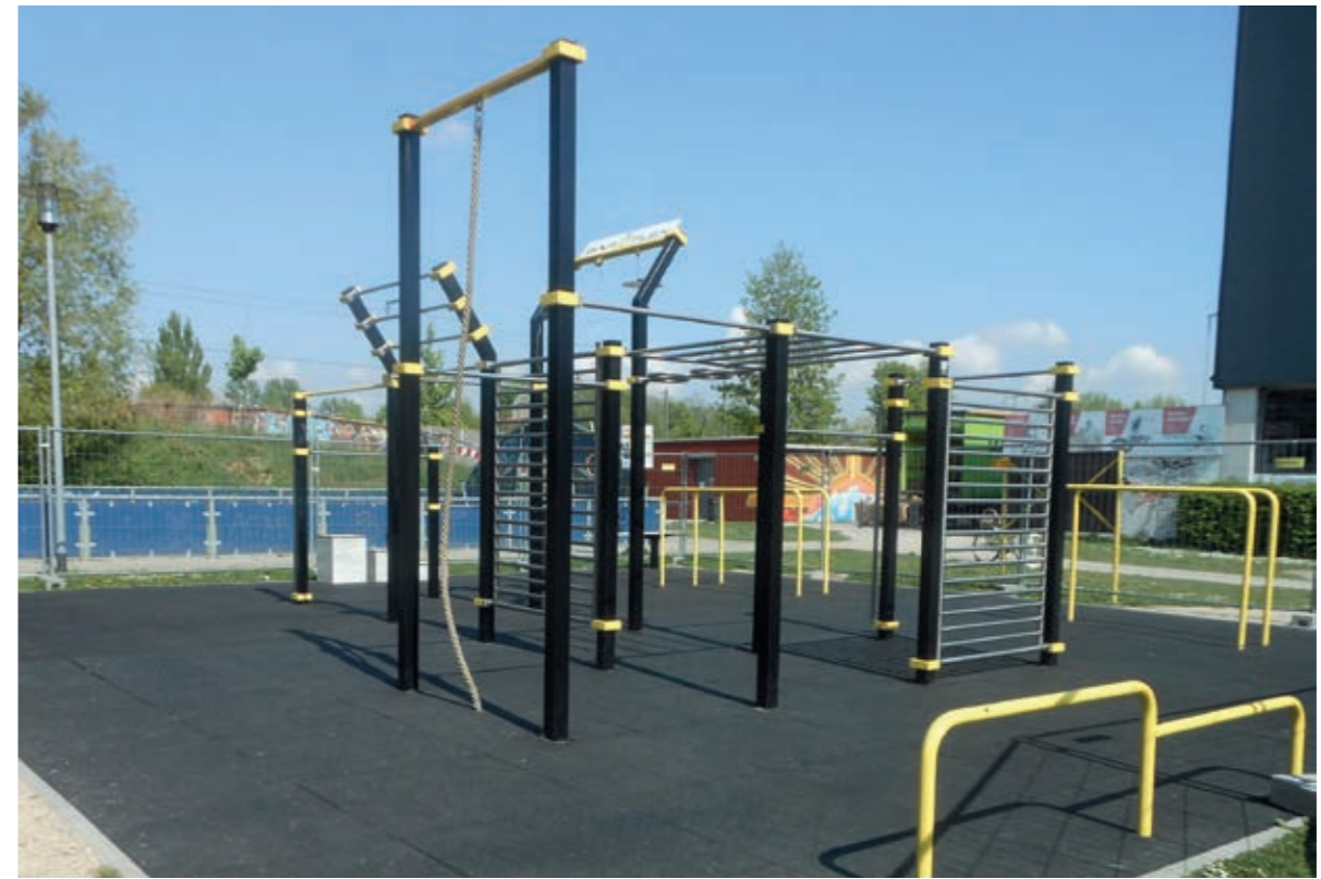
Die Calisthenics-Anlage im Spielpark Südost wurde erweitert.

Дальнейшую информацию о центрах поддержки семьи в Ингольштадте можно найти по ссылке: https://familienbildung.ingolstadt.de