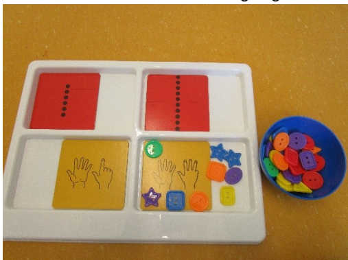
Verschiedene Zahl-Bilder – Menge zuordnen