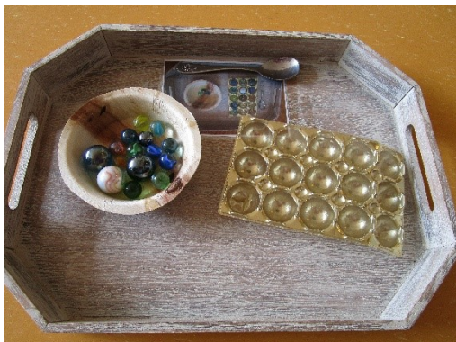
Murmeln verschiedener Größe sollen mit Hilfe eines Löffels in die Mulden gelegt werden

Neben dem alltäglichen Spiel- und Lernmaterial hat sich in unserer Einrichtung die Verwendung von Lern- und Aktionstabletts für alle Altersstufen etabliert. Dabei wird das Material für eine Übung auf einem Tablett angerichtet, das den „Arbeitsplatz“ für das Kind darstellt. Die Übung ist dabei in der Regel selbsterklärend und kann von dem Kind selbstständig ausgeführt werden. Das Material bleibt auf dem Tablett und wird nach beenden der Übung so wieder komplett zurück in den Schrank geräumt. Die Übungen können aus allen Lernbereichen sein, beispielsweise Schneideübungen, zählen, schütten, Feinmotorik oder Farbenlehre.