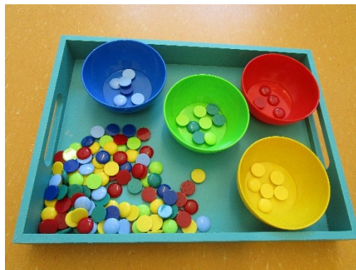
Die Farb-Chips sollen in die entsprechenden Farbschälchen einsortiert werden