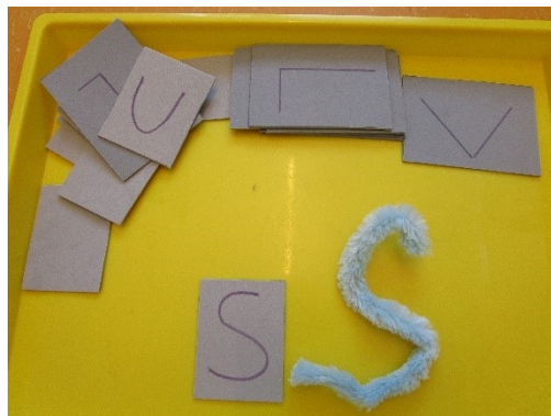
vorgegebene Formen mit Draht biegen