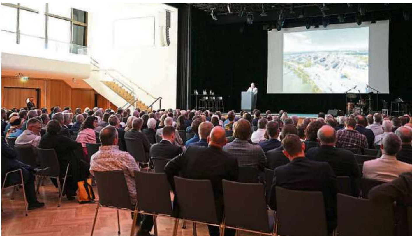
Der Saal Ingolstadt