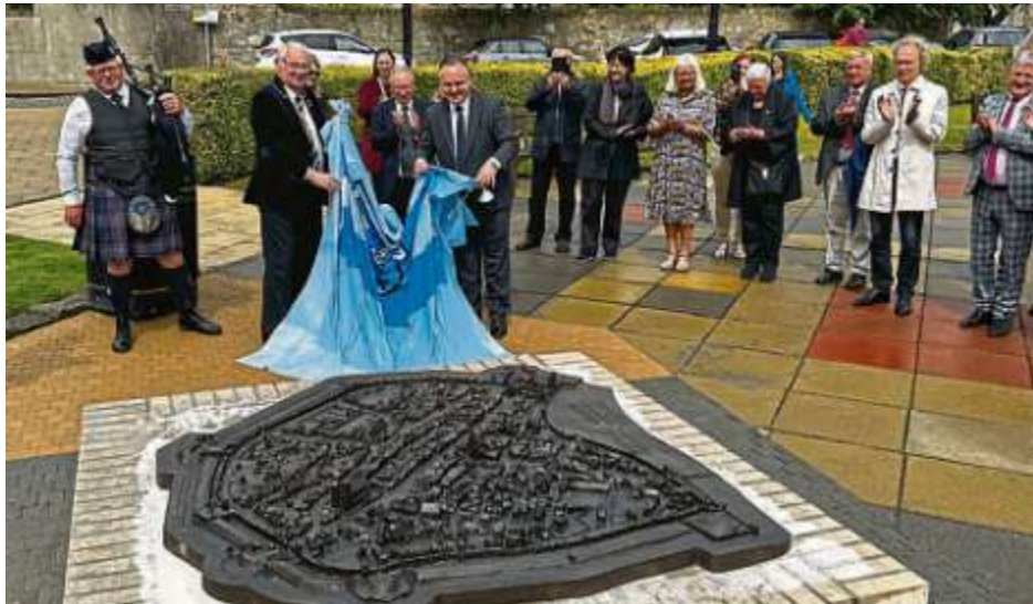
Ein Geschenk zum Jubiläum: Das Sandtnermodell steht nun auch in Kirkcaldy.