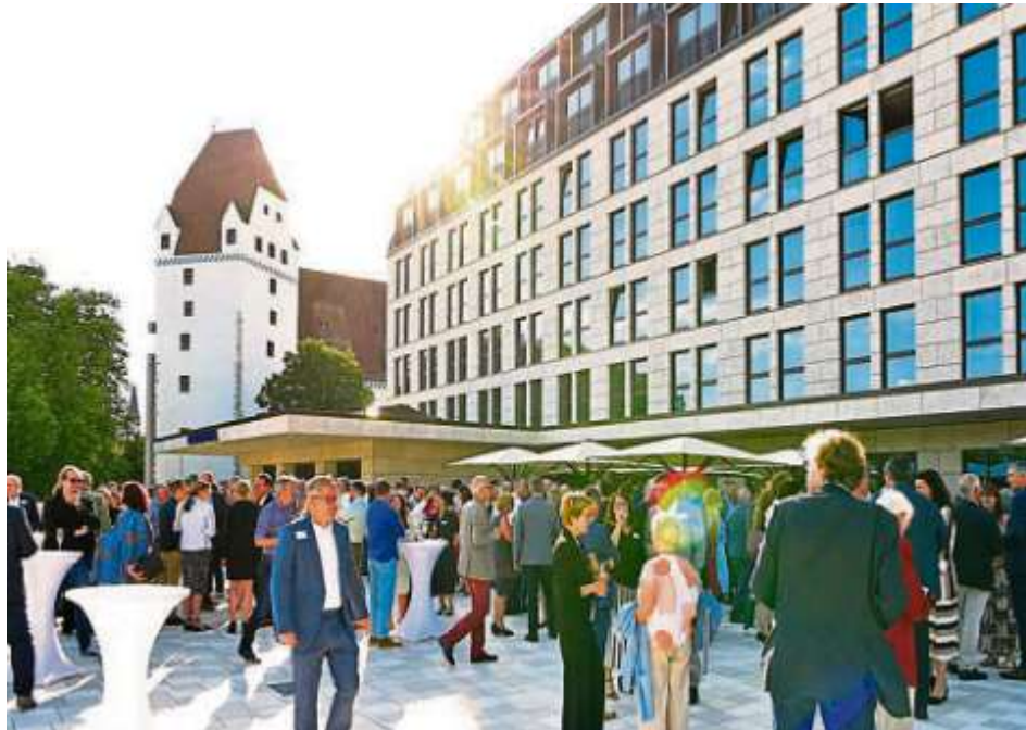
„Get together“ auf der Terrasse des neuen Maritim-Hotels mit Blick auf das Neue Schloss.

Hierbei unterstrich Scharpf die Bemühungen der Stadt um eine gute Standortpolitik, die entscheidend für eine lebens- und liebenswerte Stadt und zugleich für einen