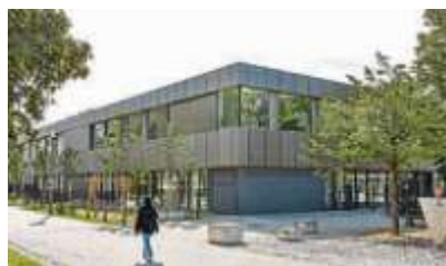
Viel Platz für Schule Erweiterungsbau der Kolumbus-Schule