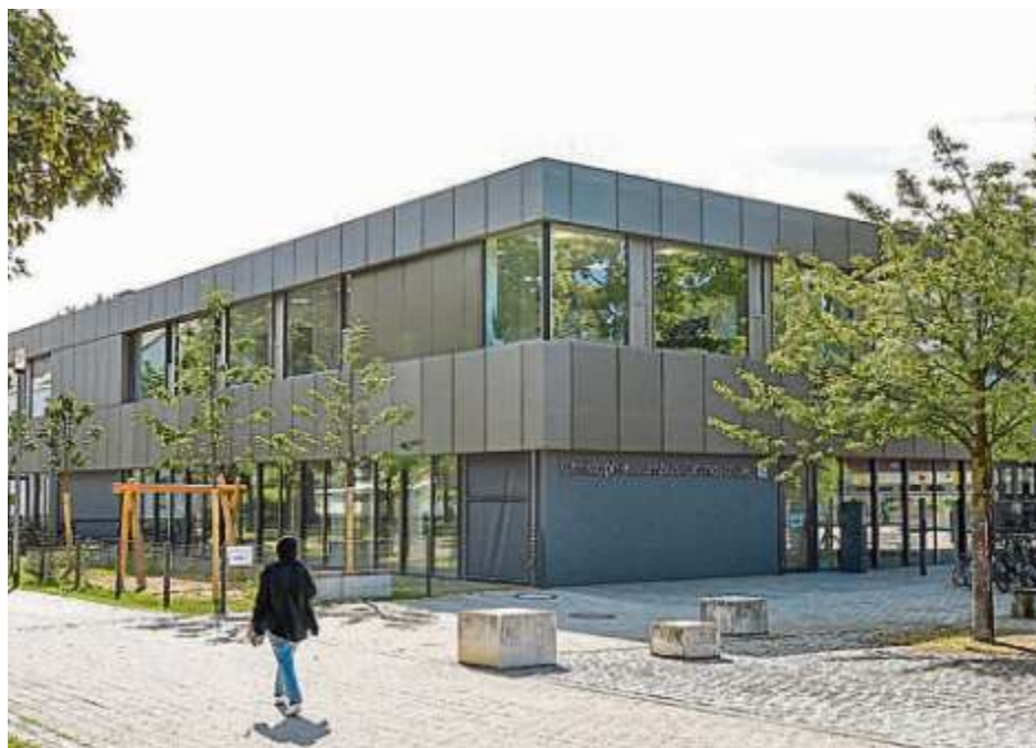
Der neue Erweiterungsbau der Christoph-Kolumbus-Grundschule ist bereits seit Dezember in Betrieb – nun wurde er auch offiziell eingeweiht.