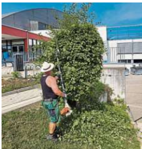
Formschnittarbeiten im Außenbereich

ckeyprofis und das eisbegeisterte Publikum ist.