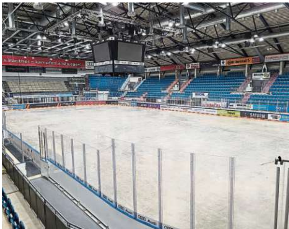
Die (noch) leere gekühlte Betonpiste kurz vor der Aufeisung

Neben dem Zuhause des ERC Ingolstadt ist die Saturn Arena auch eine Freizeitanlage für alle Gäste, die es gerne etwas kühler haben. Die gutbesuchte Eisdisco befindet sich in der Planung und wird auch dieses Jahr wieder alle Besucher mit fetziger Musik, bunten Licht-Effekten und spannenden Mottos begeistern. Wer es lieber etwas ruhiger mag, dem seien die öffentlichen Eisläufe ans Herz gelegt, um in der Freizeit einfach ein paar Runden auf dem Eis mit Freunden oder Familie zu drehen.