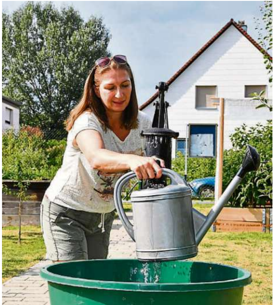
Ein Brunnen zur Gartenbewässerung spart kostbares Trinkwasser und schont damit die wertvolle Ressource und den Geldbeutel.

Das wünschen sich die Ingolstädter Kommunalbetriebe (INKB) und haben es sich als Ziel gesetzt. Damit das gelingt, veranlasst der kommunale Wasserversorger verschiedene Maßnahmen, um das Tiefengrundwasser zu schonen. Sofern möglich, soll es durch oberflächennahes Grundwasser ersetzt werden. Schließlich gibt es Verwendungen, wo Trinkwasserqualität nicht unbedingt erforderlich ist. Beispielsweise beim Garten gießen, bei der Toilettenspülung oder für die industrielle Nutzung. Diese sogenannten Betriebswässer sind typischerweise Regenwasser, Wasser aus Quellen oder eben oberflächennahes Grundwasser. Die INKB fördern seit Jahren den Einsatz von dezentralem Betriebswasser. Davon können Privatpersonen ebenso wie Geschäfte, Vereine oder Industriebetriebe profitieren. Sie zahlen Zuschüsse für den Bau von Gartenbrunnen und die Errichtung von Regenwasserzisternen. Zudem entfällt die Abwassergebühr für die Einleitung des Betriebswassers. Indirektes Sparpotential ergibt sich durch weniger Trink- und Abwassergebühren. Im industriellen Bereich ermöglicht der Wasserversorger zusätzliche Einsparmöglichkeiten, indem er die Betriebe über eine zentrale Versorgungsleitung aus eigenen oberflächennahen