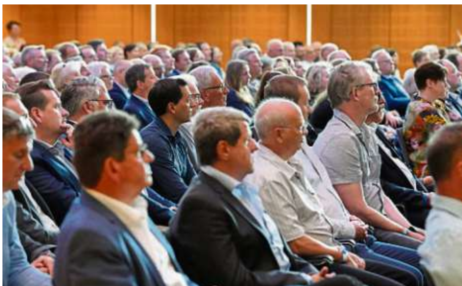
Die geladenen Gäste erhielten spannende Einblicke in das Projekt