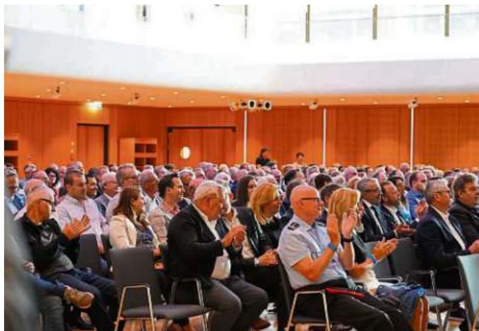
Applaus für alle Rednerinnen und Redner

Die IFG Ingolstadt freut sich auf spannende und interessante Veranstaltungen im neuen Congress Centrum Ingolstadt, sowie auf die langfristige gute Zusammenarbeit mit Maritim.