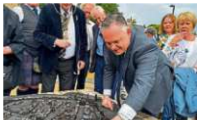
Stadtmodell zum Jubiläum 60 Jahre Städtepartnerschaft mit Kirkcaldy