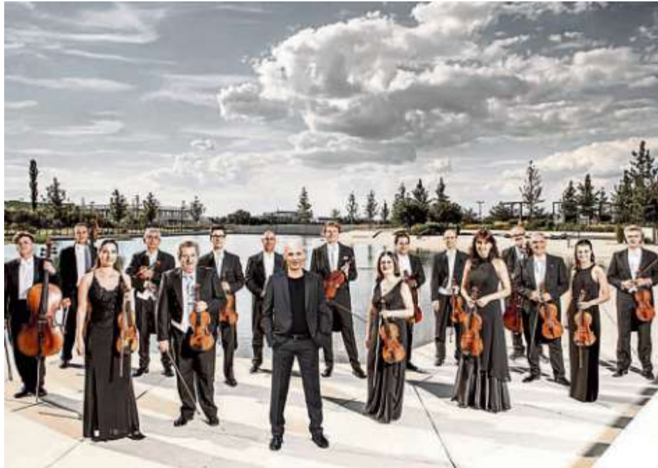
Das Georgische Kammerorchester startet am 21. September in die neue Saison.

Im September startet das Georgische Kammerorchester Ingolstadt unter dem Motto „Wenn Musik die Welt verändert“ in die neue Saison 2023/24. Für die Konzerte hat der freie Kartenvorverkauf bereits begonnen. Tickets für die einzelnen Konzerte der Saison sind online unter www.ticket-regional.de sowie an den bekannten Vorverkaufsstellen erhältlich. Die Einzelkarten kosten 52 Euro, 44 Euro und 36 Euro, mit der neu eingeführten Vorteilscard reduzieren sich die Preise auf 47 Euro, 40 Euro und 32 Euro. Für den Erhalt der Vorteilscard ist lediglich eine einmalige Registrierung mit Namen und Adressdaten erforderlich. Schüler, Auszubildende und Studierende können weiterhin Karten zum Preis von zehn Euro erwerben; zehn Minuten vor Konzertbeginn werden außerdem für alle Interessierten Last-Minute-Tickets für fünf Euro freigegeben. Inhaber des Ingolstadt Passes erhalten fünf Minuten vor Konzertbeginn kostenlose Restkarten. Wie bei vielen anderen Orchestern bereits üblich, wird es einen Seniorenpreis zukünftig nicht mehr geben; dafür