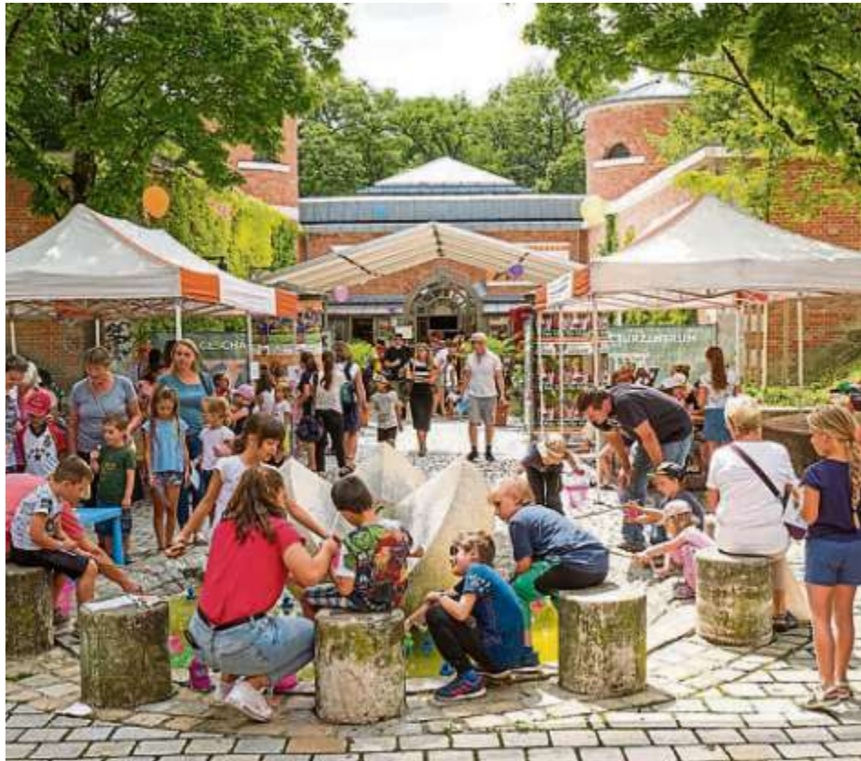
Das Ferienpass-Programm startet am 29. Juli mit einem großen Fest an der Fronte 79.

Wie gewohnt gibt es auch in diesem Jahr ein Gutscheinheft mit jeder Menge Vergünstigungen. Und das Beste: es kann unter www.sjr-in.de/Ferienpass als PDF gratis heruntergeladen, ausgedruckt und ausgefüllt werden. Ebenfalls wieder mit dabei ist die vergünstigte Bademarke: Für acht Euro kann das städtische Freibad während der gesamten Ferienzeit beliebig oft besucht werden. Die Bademarke ist ausschließlich beim Stadtjugendring Ingolstadt in der Fronte, Jahnstraße 25, erhältlich. Einige Angebote des Ferienpasses sind besonders erwähnenswert. So wird ein Lego Trickfilm Ferienworkshop unter der Leitung eines echten Regisseurs angeboten. In diesem viertägigen Kurs lernen