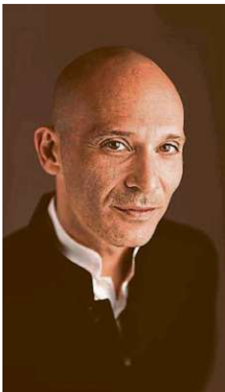
Der künstlerische Leiter des GKO Ariel Zuckermann.

Am 21. September um 20 Uhr wird die Saison im Festsaal Ingolstadt eröffnet: Der Klaviervirtuose Boris Giltburg feiert den 150. Geburtstag Sergej Rachmaninows mit dem berühmten Klavierkonzert Nr. 3; eine „Apotheose des Tanzes“ im Doppelpack gibt es mit der Siebten von Beethoven und dem schwedischen Komponisten Mats Larsson Gothe. Zehn Abonnementkonzerte im Monatsrhythmus bilden eine Konstante während der Ingolstädter Saison; die Pico Cello-Reihe – beliebt bei Groß und Klein – begleitet die Konzerte und bietet reichhaltige Angebote für Kinder- und Jugendliche aller Altersstufen. In drei Sonderkonzerten und zwei Open Airs im Frühjahr und Sommer 2024 werden besondere Programme von Barock bis Klezmer präsentiert. Mit dem israelischen Dirigenten und Flötisten Ariel Zuckermann ist ein Künstlerischer Leiter von internationalem Renommee engagiert, der jetzt seine dritte Saison in Ingolstadt antritt. Internationale Solisten und Gastdirigenten bereichern die ausgefeilten und facettenreichen Programme. Das Programm und viele weitere Infos sind außerdem auf der Website des Orchesters zu finden: www.gko-in.de .