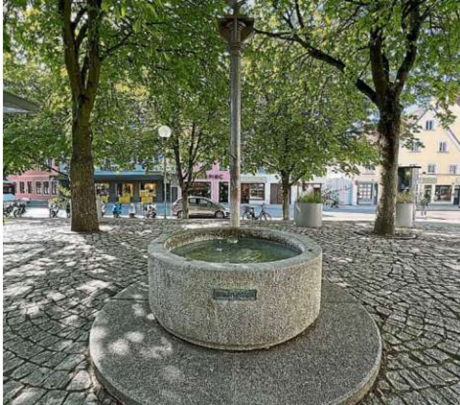
In Ingolstadt stehen insgesamt neun Trinkwasserbrunnen – wie hier am Viktualienmarkt – zur Verfügung.

Die Stadt Ingolstadt bittet insbesondere Besucher von Wäldern, Grün- und Freizeitanlagen sowie der Badeseen unbedingt die folgenden Verhaltensregeln des Bayerischen Waldgesetzes und der