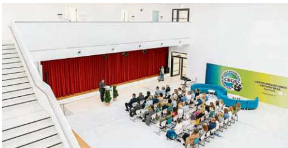
Die Veranstaltung zur Einweihung fand in der neuen, großzügigen Aula statt, die vielseitig genutzt werden kann.

Im Zuge der Maßnahme wurde der Pausenhof Nord ebenfalls neugestaltet. Er dient hauptsächlich zum Ankommen vor Schulbeginn und bietet künftig neben Spielgeräten, Sitzgelegenheiten und ausreichend Fahrradständern auch Platz für Schulfeste. Das Dach des Erweiterungsbaus wurde weitestgehend extensiv begrünt und im Sinne der Nachhaltigkeit mit einer 60 kWp leistenden Photovoltaikanlage ausgestattet. Mit dem Bau des Erweiterungsgebäudes wurde im März 2020 begonnen, seit Ende vergangenen Jahres sind die Räume in Nutzung. Die Christoph-Kolumbus-Grundschule wird derzeit von über 470 Schülerinnen und Schülern besucht.