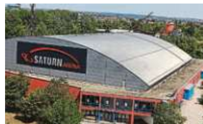
Blick hinter die Kulissen Sommerarbeiten in der Saturn-Arena