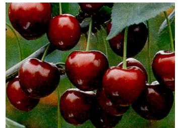
IM LEHRGARTEN WERDEN NEBEN ETWA 35 VERSCHIEDENEN SÜSS- UND SAUERKIRSCHEN AUCH ZAHLREICHE ZWETSCHGEN, RENECLLOUDEN, MIRABELLEN, PFIRSICHE, APRIKOSEN UND NEKTARINEN ANGEBAUT.