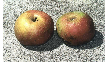
ROTER BOSKOOP (S. BILD) ODER ONTARIO, ALKMENE ODER PIROS, GOLDPARMÄNE ODER KLARAPFEL: ÜBER 40 VERSCHIEDENE APFELSORTEN KÖNNEN IM OBSTLEHRGARTEN BESICHTIGT UND PROBIERT WERDEN.

Der Ingolstädter Obstlehrgarten wurde 1998 auf dem Betriebsgelände des Gartenamtes eröffnet. Aufgrund mehrjähriger Folgepflanzungen in der Anlage ist es möglich, die Regeln des richtigen Obstbaumschnitts zur Baumerziehung kennenzulernen. Alljährlich durchgeführte Schnittkurse laden zur praktischen Übung vor Ort ein. Über 150 altbewährte und neue, bekannte oder seltene Arten und Sorten, verschiedene Erziehungssysteme und Unterlagentypen sind mit wetterfesten Schildern versehen und beschrieben. Obstspalier an den Betriebsgebäuden ergänzen den Lehrgarten.