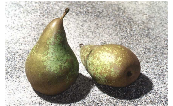
NEBEN DER HIER ABGEBILDETEN PASTORENBIRNE KÖNNEN WEITERE 25 BIRNEN, QUITTEN UND NASHISORTEN IM GARTENAMT MITEINANDER VERGlichen WERDEN.