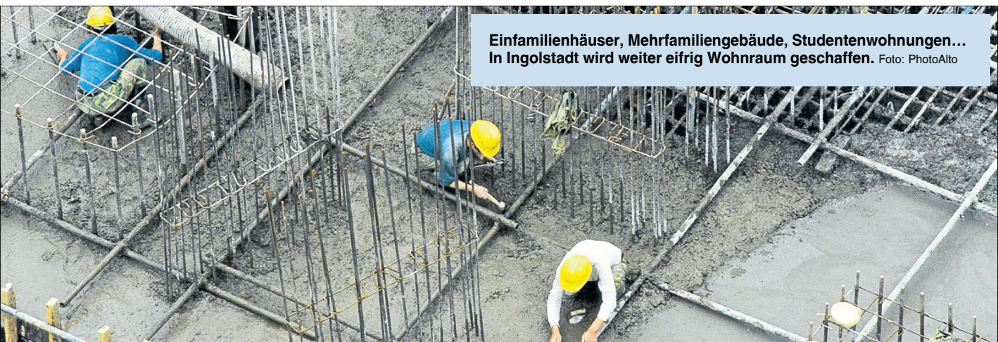
Einfamilienhäuser, Mehrfamiliengebäude, Studentenwohnungen... In Ingolstadt wird weiter eifrig Wohnraum geschaffen.

Bei der Bebauung setzt die Stadt auch auf Innenentwicklung