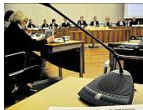
Viel zu besprechen: Der Stadtrat diskutiert die Pläne zur Neugestaltung des Rathausplatzes.

Doch vor all diesen Veränderungen steht eine Grundsatzentscheidung: Soll der Rathausplatz eine Multifunktionsfläche bleiben oder zum „gemütlichen Wohnzimmer“ werden. Für zwei Drittel des Stadtrates ist die Sache klar, sie sprachen sich eindeutig dafür aus, dass der Rathausplatz „beispielbar“ bleiben muss. Das heißt, Elemente, wie zum Beispiel die Sitzmöbel, sollten mobil sein, so dass sie für größere Veranstaltungen einfach weggerückt werden können. „Der Rathausplatz ist der einzige Platz im Zentrum, der größere Veranstaltungen erlaubt“, betont Lösel. Man denke nur an das Public Viewing (das sich vor allem viele Jugendliche wieder hier wünschen) oder auch die Meisterschaftsfeier des ERCI. „Mir ist wichtig, dass die Vorschläge, die jetzt erarbeitet werden, vor einem endgültigen Beschluss noch mal mit den Bürgern diskutiert werden“, so der Oberbürgermeister. Genau das passiert jetzt übrigens auch bei der Fußgängerzone. Am 18. März um 19 Uhr werden im Orbsaal die Architekturvorschläge aus dem Ideenwettbewerb zur Umgestaltung der Fußgängerzone öffentlich präsentiert und diskutiert. Die Arbeiten sind vom 14. bis 20. März ausgestellt.