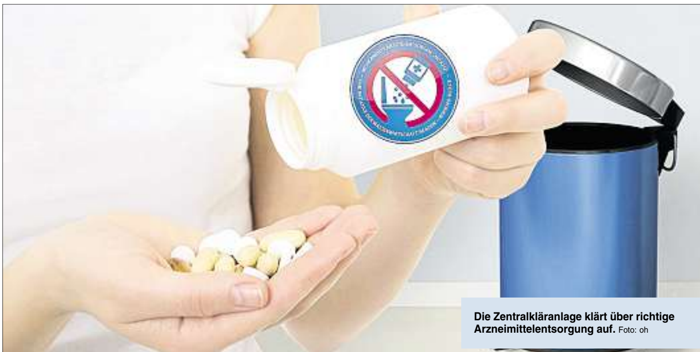
Die Zentralkläranlage klärt über richtige Arzneimittelentsorgung auf.

Die ZKA informiert: Medikamente gehören nicht ins WC