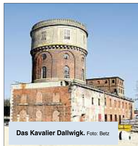
Das Kavalier Dallwigk.