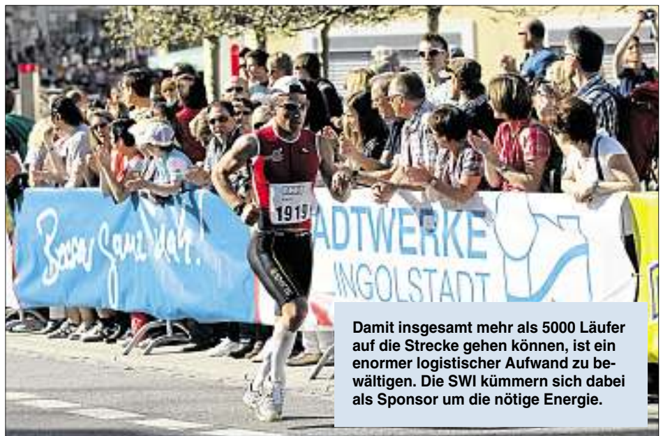
Damit insgesamt mehr als 5000 Läufer auf die Strecke gehen können, ist ein enormer logistischer Aufwand zu bewältigen. Die SWI kümmern sich dabei als Sponsor um die nötige Energie.

Vielen Dank und viel Erfolg für die Veranstaltung am Wochenende.