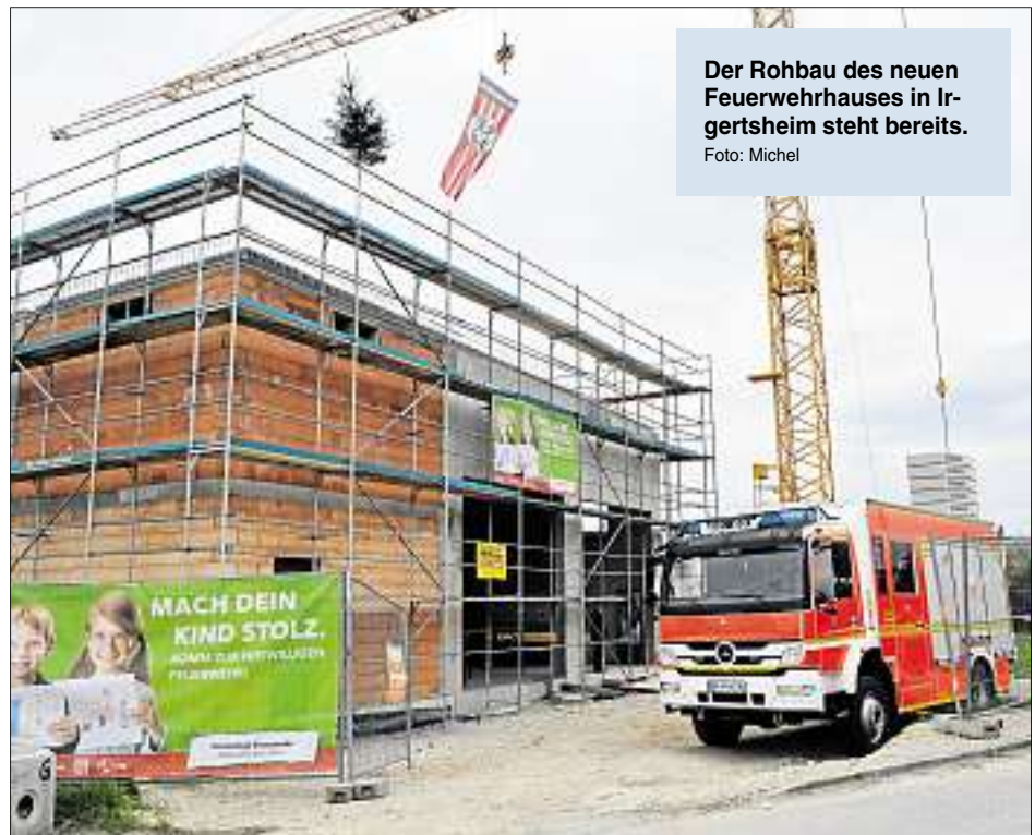
Der Rohbau des neuen Feuerwehrhauses in Irgertsheim steht bereits.

Das neue Gerätehaus besteht im Wesentlichen aus einer 100 Quadratmeter großen Fahrzeughalle sowie Ausbildungs-, Aufenthalts- und Verwaltungsräumen (120 Quadratmeter). Ergänzend gibt es Räume für Einsatz- und Übungsabwicklung sowie Werkstätten und Lagerräume. Mit dem Bau des 1,3 Millionen Euro teuren Projekts konnte bereits im Oktober 2015 begonnen werden. Die Fertigstellung ist voraussichtlich im November dieses Jahres. Die Feuerwehr Irgertsheim beteiligt sich mit Eigenleistungen von rund 100 000 Euro und hilft bei den Maler-, Fliesen-, Installations- und Schreinerarbeiten, aber auch bei der Inneneinrichtung und den Außenanlagen. Der „Stützpunkt West“ hat zusammen 53 aktive Feuerwehrleute sowie 22 Anwärter in der Jugendfeuerwehr. Im vergangenen Jahr rückte die Mannschaft zu 16 Einsät-