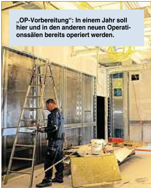
„OP-Vorbereitung“: In einem Jahr soll hier und in den anderen neuen Operationssälen bereits operiert werden.