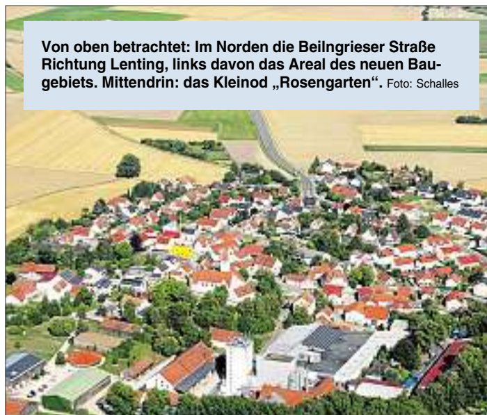
Von oben betrachtet: Im Norden die Beilngrieser Straße Richtung Lenting, links davon das Areal des neuen Baugebiets. Mittendrin: das Kleinod „Rosengarten“.