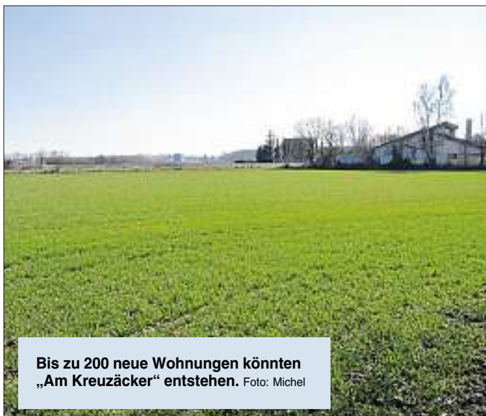
Bis zu 200 neue Wohnungen könnten „Am Kreuzäcker“ entstehen.

Das zukünftige Wohngebiet kennen viele Ingolstädter wegen des charakteristischen „Rosengartens“. Dieses beliebte Kleinod soll ausdrücklich auch nach dem Bau des Wohngebiets zur Verfügung stehen und als öffentliche Grünfläche integriert werden. Das Blumenparadies wurde einst von Johann Heindl angelegt. Auf 4500 Quadratmetern Fläche blühen rund 1300 Rosenstöcke. „Wir möchten mit dem Bebauungsplan einerseits ein verträgliches Nebeneinander der vorhandenen und geplanten Baustruktur erreichen und gleichzeitig familiengerechtes Wohnen fördern. Auch soll durch den neuen Supermarkt die Versorgung des ganzen Stadtteils mit Gütern des täglichen Bedarfs verbessert werden“, fasst Stadtbaurätin Renate Preßlein-Lehle zusammen.