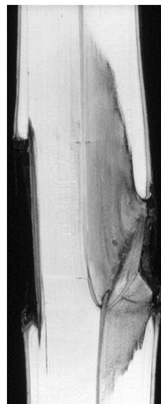
Längsschnitt durch Stamm:

Das erste Grundprinzip hat folgende Konsequenz auf die Baumpflege: Der Kronenschnitt darf nicht im Starkastbereich erfolgen, wo Kernholz betroffen ist. Fachgerechter Schnitt wird in der Kronenperipherie durchgeführt im Schwach- und Grobastbereich.