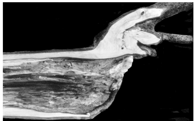
Längsschnitt durch gekappten Starkast:

Das dritte Grundprinzip hat schliesslich folgende Konsequenz auf die Baumpflege: Baumkronen dürfen nicht so stark geschnitten werden, dass sie zur Bildung einer Ersatzkrone aus schlafenden Augen und spontan gebildeten Knospen an der Schnittstelle gezwungen werden.