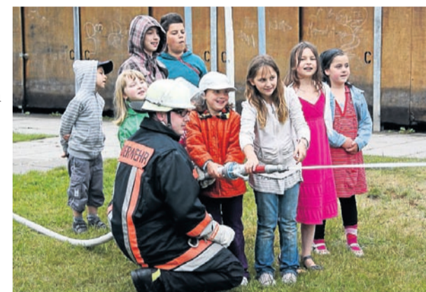
Die Kinder durften mit der Löschspritze einen Löschvorgang simulieren.