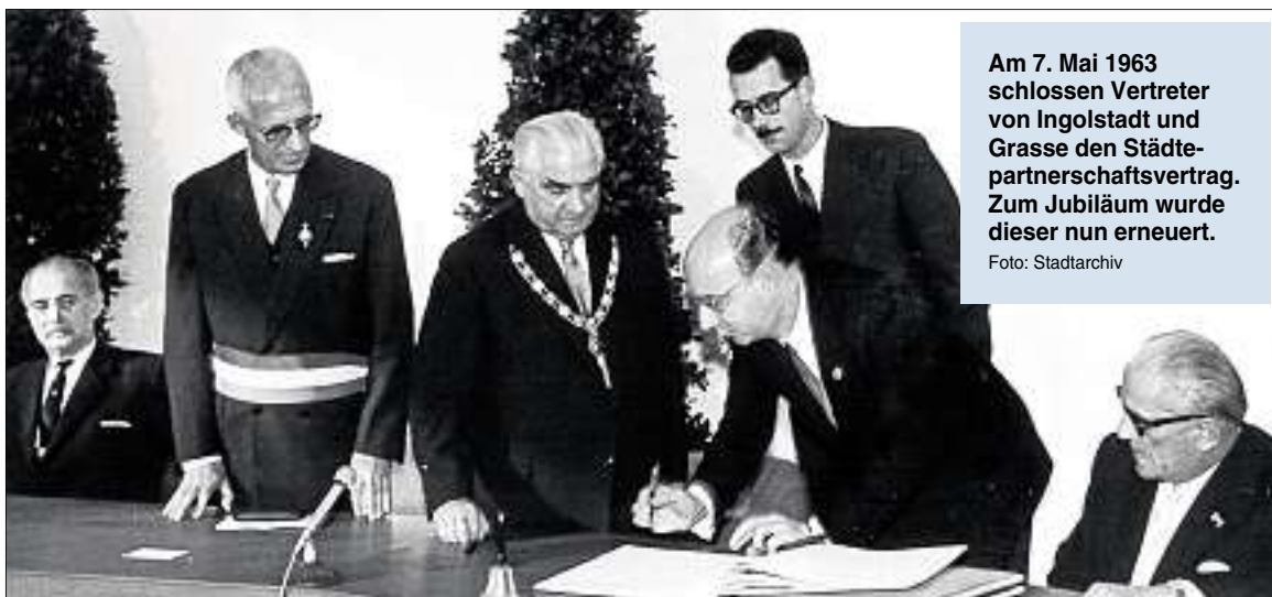
Am 7. Mai 1963 schlossen Vertreter von Ingolstadt und Grasse den Städtepartnerschaftsvertrag. Zum Jubiläum wurde dieser nun erneuert.