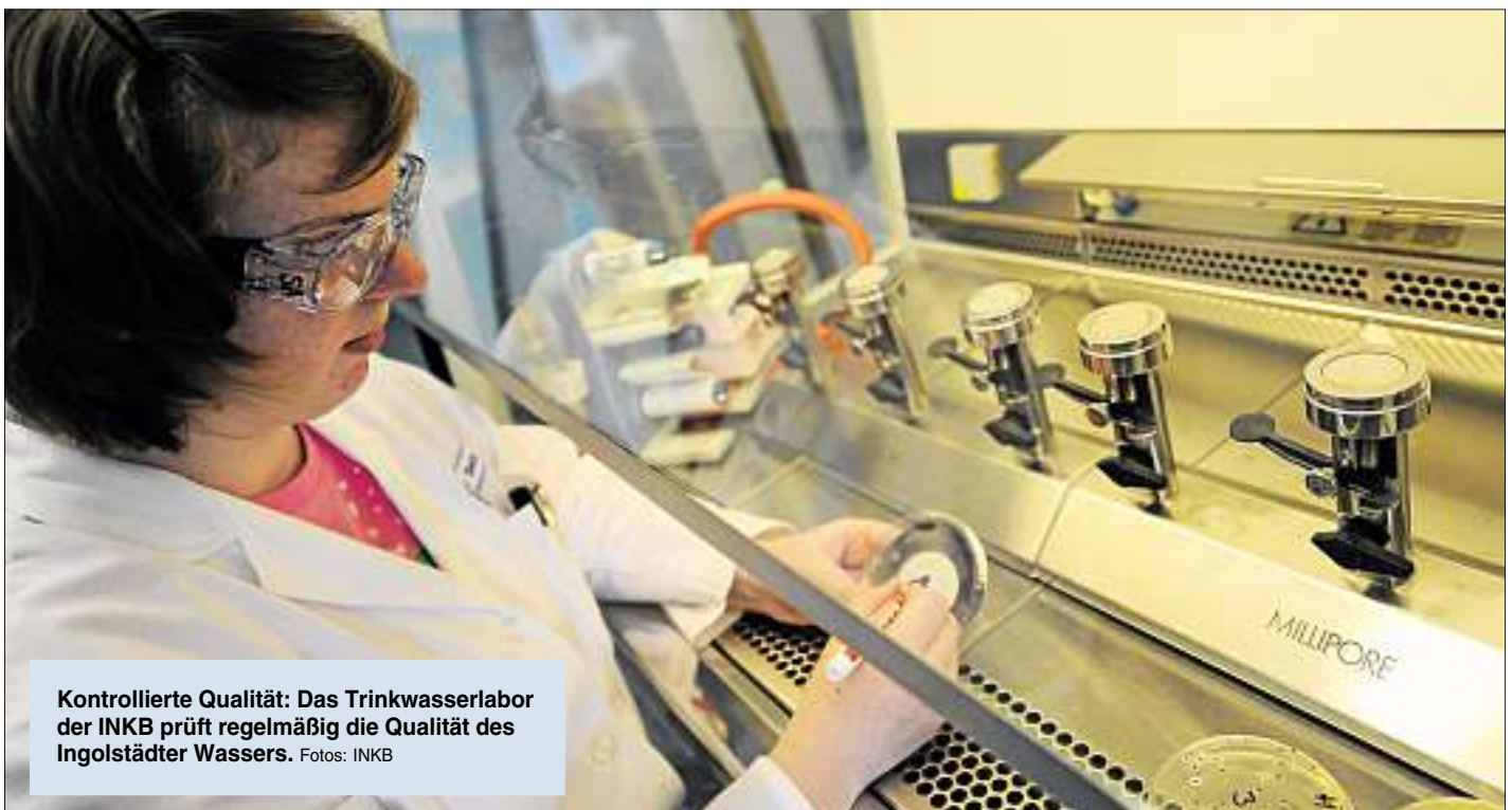
Kontrollierte Qualität: Das Trinkwasserlabor der INKB prüft regelmäßig die Qualität des Ingolstädter Wassers.

Aber auch die Bürger tragen dazu bei, indem sie sparsamer mit der wertvollen Ressource umgehen und ihre Blumen zum Beispiel mit Regenwasser gießen. Das Ingolstädter Wasser ist also nicht nur gut, sondern auch sicher.