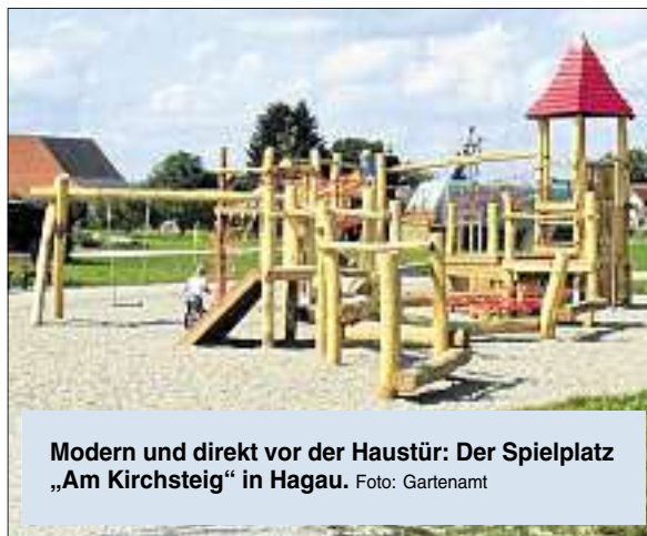
Modern und direkt vor der Haustür: Der Spielplatz „Am Kirchsteig“ in Hagau.

Sehr viele Elemente sind daher sowohl für kleinere, als auch für größere Kinder geeignet. „Wir verzichten daher bei all unseren Spielanlagen ganz bewusst auf eine Altersbeschränkung“, betont Linder. Im Internet gibt es eine Beschreibung und einen Lageplan für alle öffentlichen Spielflächen ( www.ingolstadt.de/spielanlagen ).