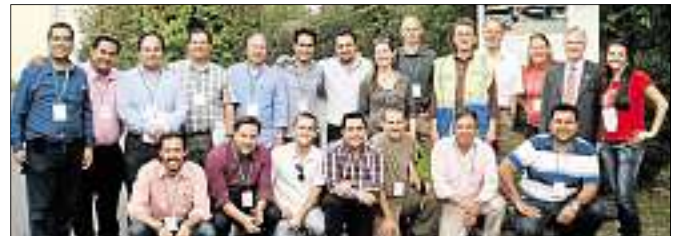
Internationale Delegationen wie diese aus Chile interessieren sich für die Bioenergie „made in Ingolstadt“.

Die Bioenergieanlage „made in Ingolstadt“ stößt daher auf großes Interesse. So sind nicht nur regelmäßig zahlreiche regionale Besuchergruppen etwa von Audi, der Pionierschule der Bundeswehr in Ingolstadt, der Hochschule Ingolstadt, der Freiwilligen Feuerwehr Stammham oder der Seniorenverein Hepberg zu Gast, sondern auch mehrere internationale Delegationen.