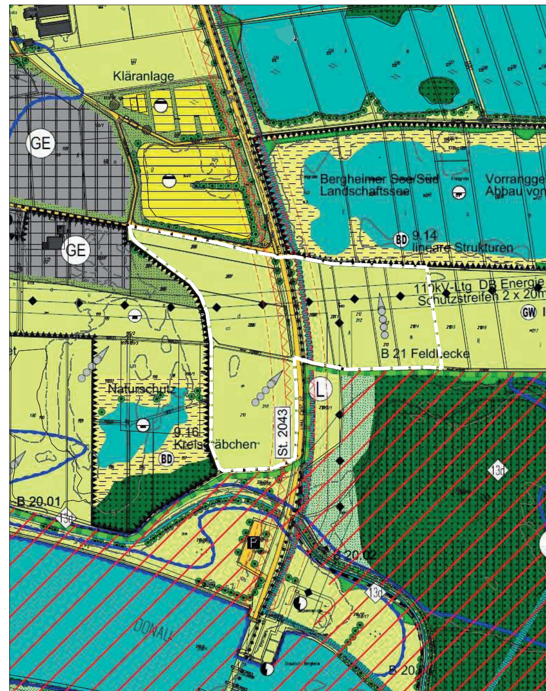
AUSSCHNITT AUS DEM RECHTSWIRKSAMEN FLÄCHENNUTZUNGSPLAN MIT INTEGRIERTEM LANDSCHAFTSPLAN