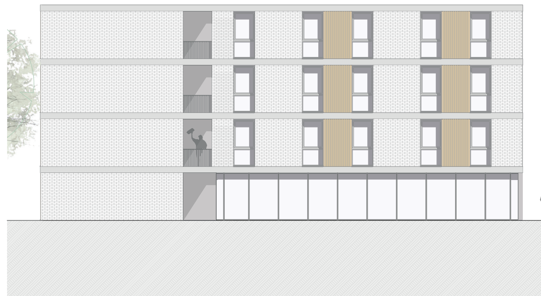
Ansicht Ost M 1:100