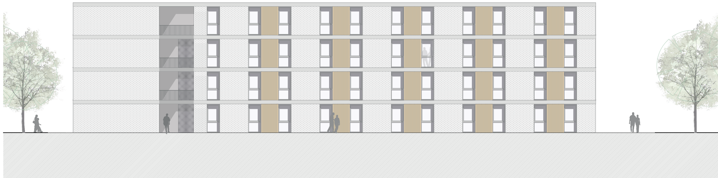
Ansicht Süd M 1:100