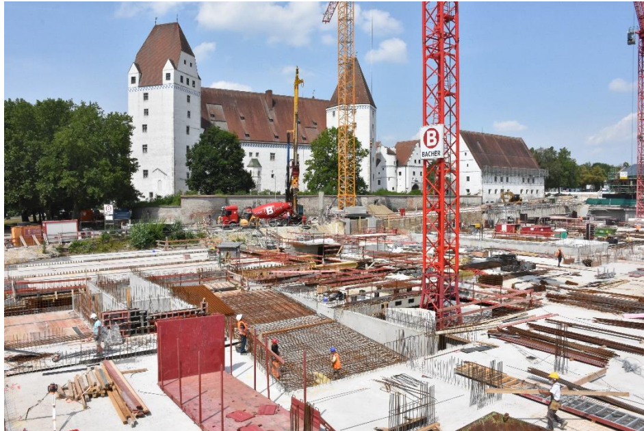
Bau Hotel- und CongressCentrum