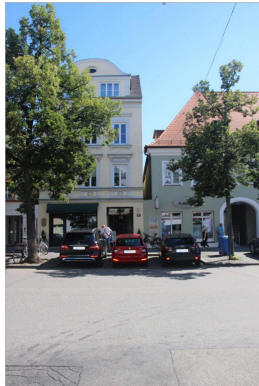
Ruhender Verkehr/ Anlieferung