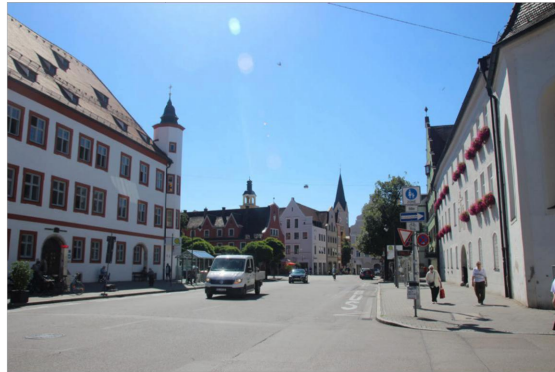
Reduzierung der Fahrbahnbreite