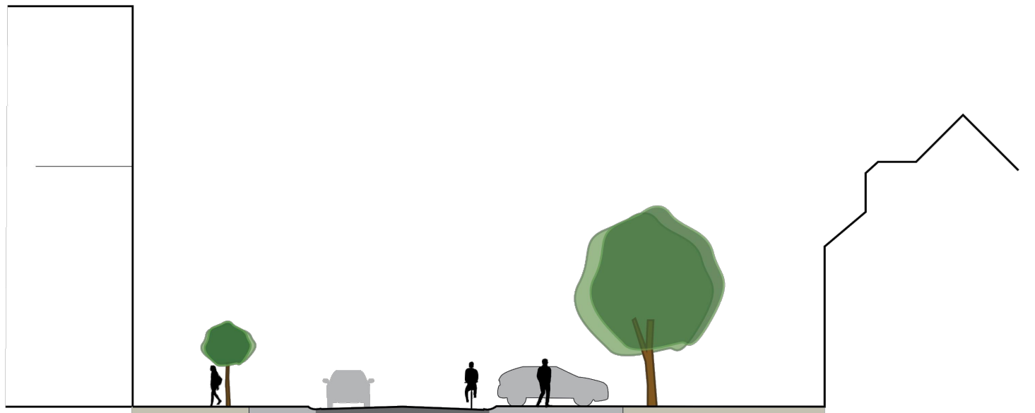
Schnitt B Konzept