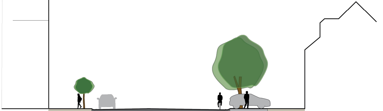
Schnitt B Bestand