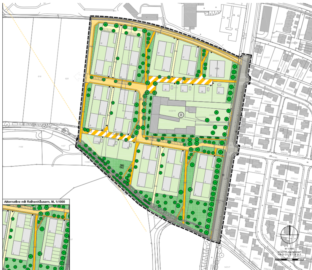
Abbildung 1: Bebauungsplan Nr. 107 H „Am Samhof“

In einem Verkehrsgutachten der TRANSVER GmbH 1 wurden die verkehrlichen Auswirkungen des Bebauungsplanes 107 H ermittelt und bewertet. Diesem Gutachten liegt der Stand des B-Planes vom 12.09.2016 zu Grunde, siehe Abbildung 1.