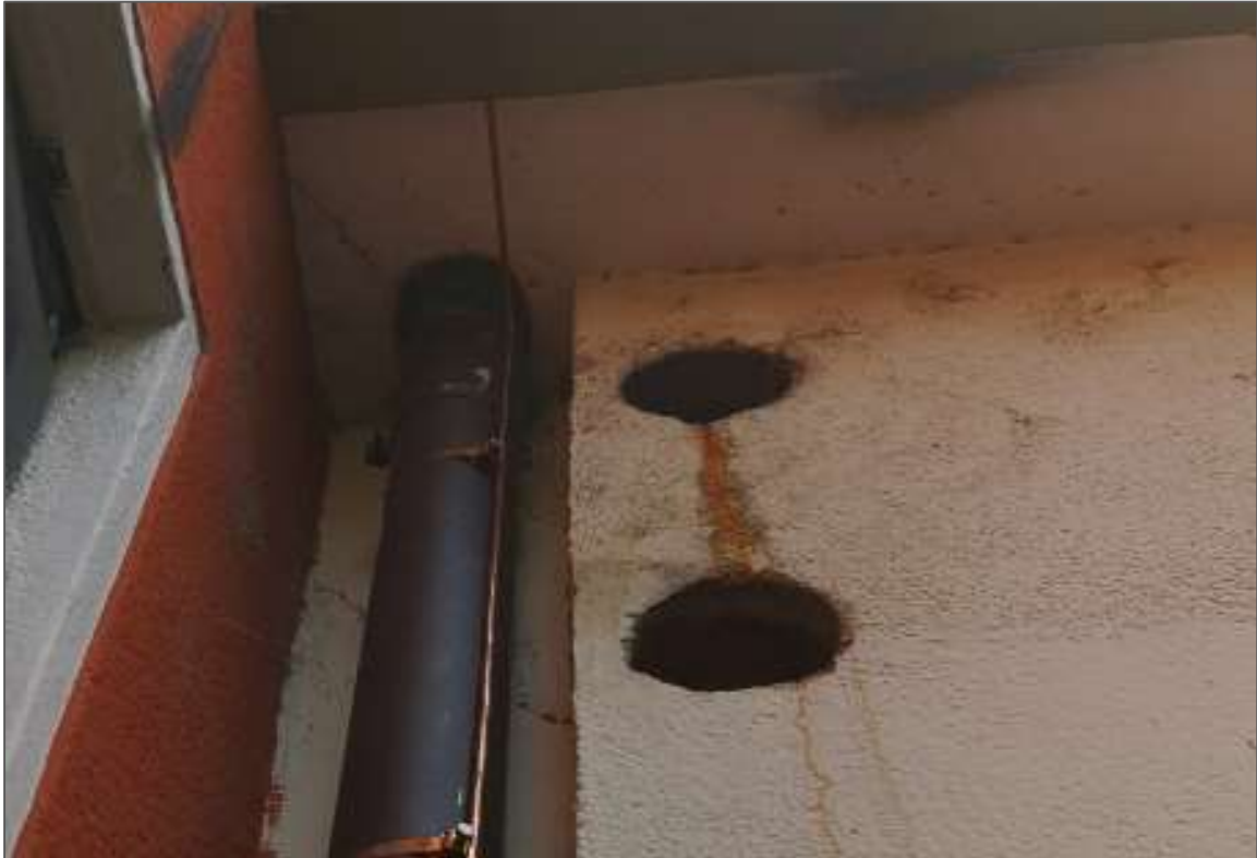
Abb.5: Fallrohr und Fassadenöffnungen mit Verbindung zur Entlüftung des WC der Bäckerei.