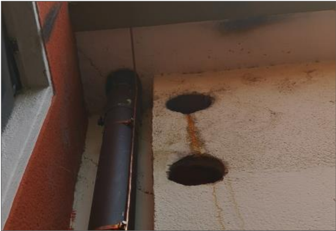
Abb.2: Fallrohr und Fassadenöffnungen mit Verbindung zur Entlüftung des WC der Bäckerei.