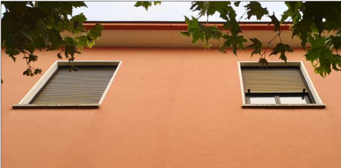
Abb.6: Fenster mit Jalousie im 1. OG.