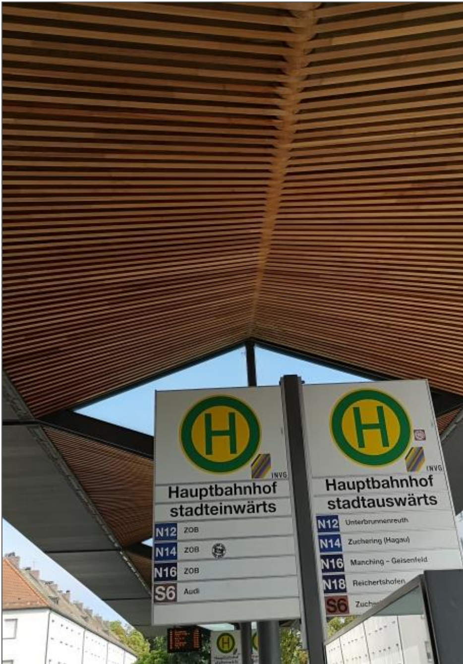
Abb.4: Lamellenförmige Dachkonstruktion im Bereich der Bussteige.