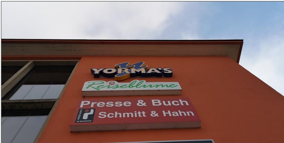
Abb.1: Übergang Dach – Fassade im Bereich des Haupteinganges.