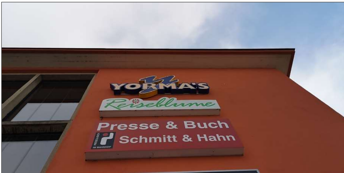
Abb.4: Übergang Dach – Fassade im Bereich des Haupteinganges.