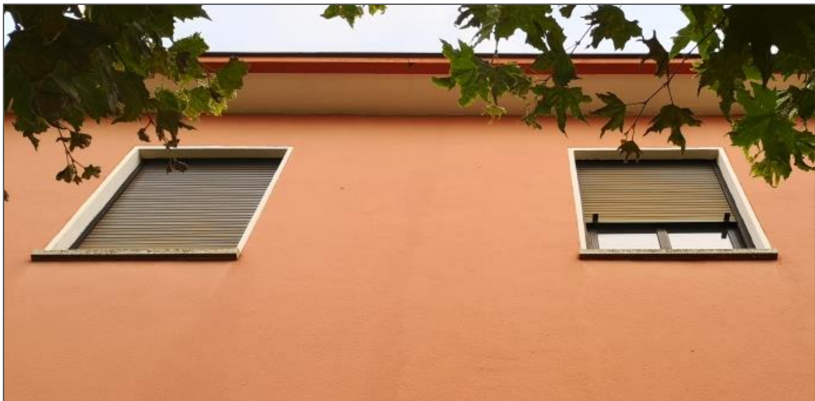
Abb.3: Fenster mit Jalousie im 1. OG.