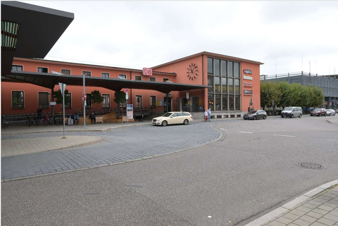
Abb.2: Derzeitiges Gebäude des Hauptbahnhofes Ingolstadt.