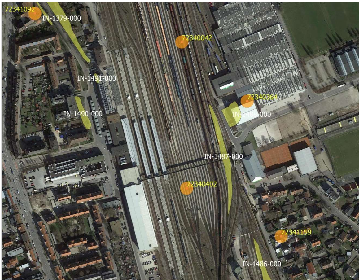
Abb.3: Flächen aus der Biotopkartierung und Punktnachweise aus der ASK (Bayerisches LfU, Augsburg).

Die im Umfeld des Hauptbahnhofes liegenden Punktnachweise aus der ASK beziehen sich auf überwiegend veraltete Nachweise von Schmetterlings- und Laufkäferarten, die ebenfalls keinen Lebensraumbezug zu dem zu begutachtenden Bahnhofsgebäude haben.