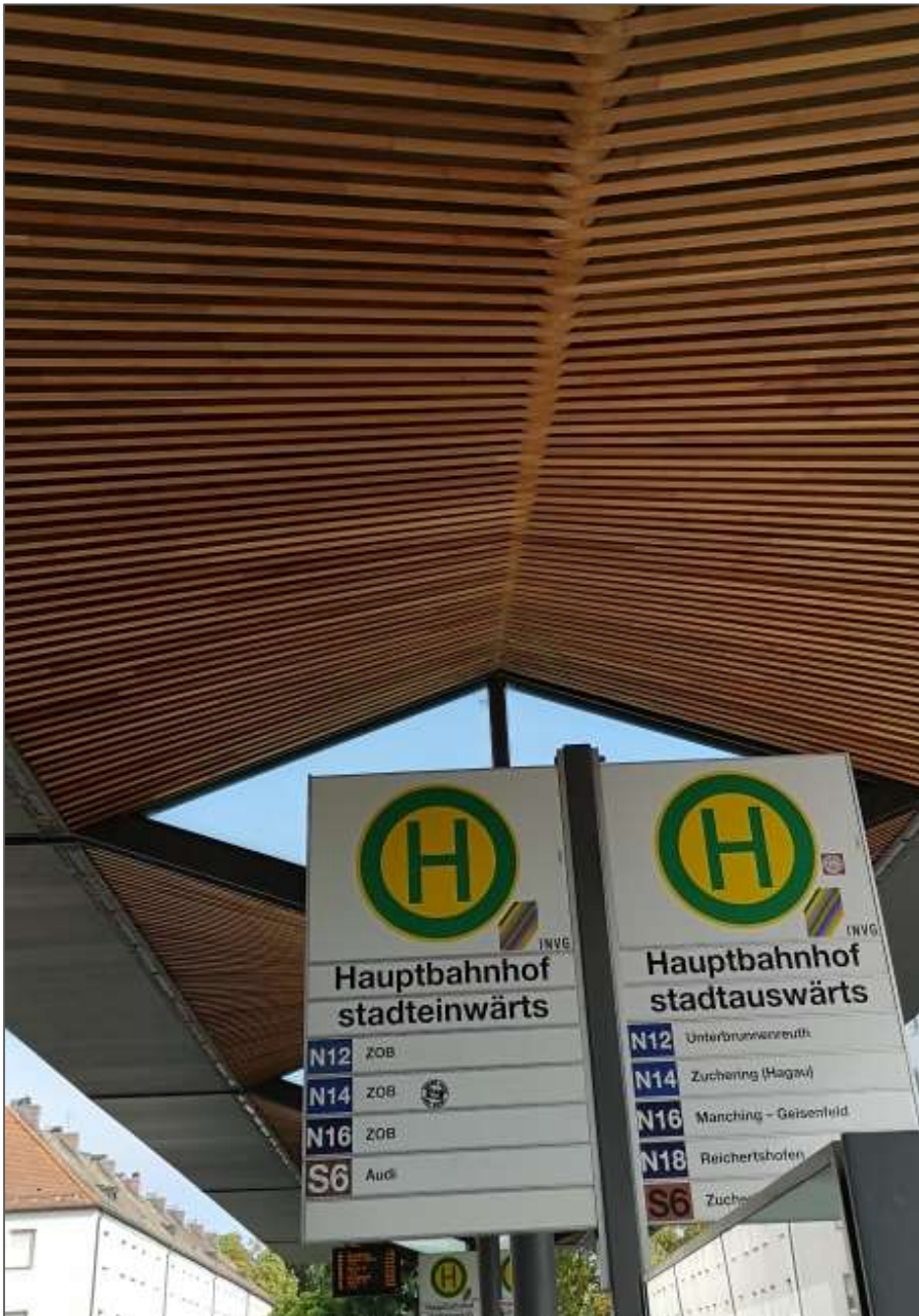
Abb.7: Lamellenförmige Dachkonstruktion im Bereich der Bussteige.