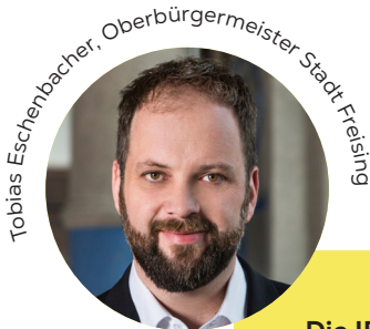
Tobias Eschenbacher, Oberbürgermeister Stadt Freising

Die IBA ist eine große Chance für die Region. Durch ihre professionelle Begleitung werden wichtige Projekte endlich umgesetzt.