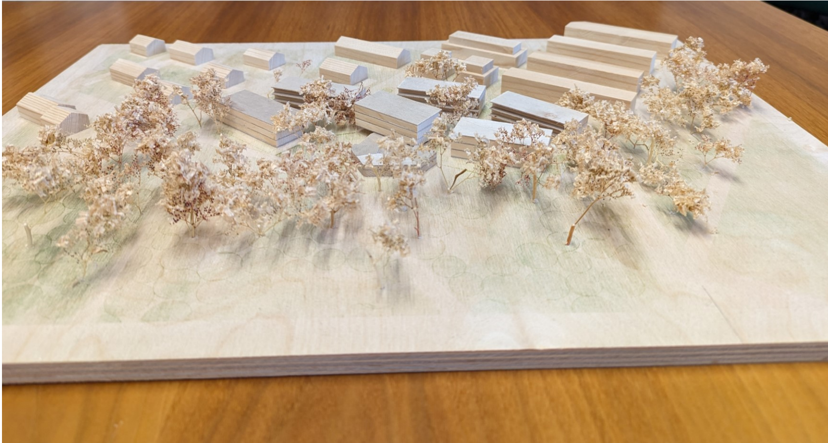
Planung Januar 2023 Variante 1