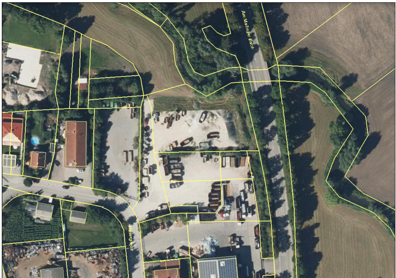
Abbildung 2: Derzeitiger Zustand des Betriebsgeländes Lage der geplanten Halle (Abb. O. Maßstab)

Eine Sichtung der ASK-Daten ergab keinerlei Funde prüfungsrelevanter Arten auf dem Betriebsgelände.