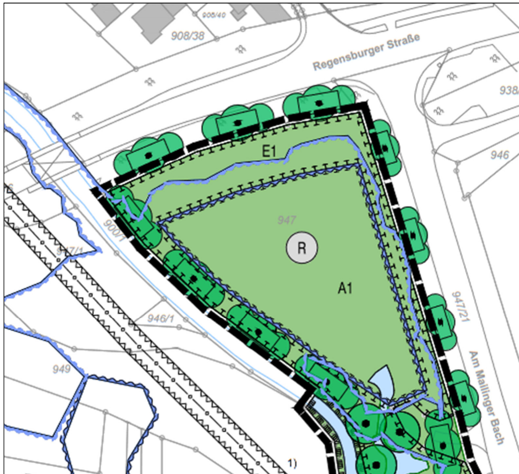
Abbildung 3: Ausschnitt aus dem Bebauungs- und Grünordnungsplan Nr. 710 A des Stadtplanungsamts Ingolstadt auf der Fl.-Nr. 947, Gemarkung Mailing. Geplant ist eine Retentionsfläche durch Tieferlegung sowie die Anlage eines kleinen Amphibiengewässers (Stand 21.03.2024)

Nach dem Bebauungs- und Grünordnungsplan Nr. 710 A „Mailing – Recyclinghalle am Mailinger Bach“ ist auf der o. g. Auewiese entlang des Mailinger Bachs eine Geländeabsenkung zur Schaffung eines Hochwasserretentionsraums geplant. In Bachnähe ist zudem die Anlage eines Amphibiengewässers vorgesehen.