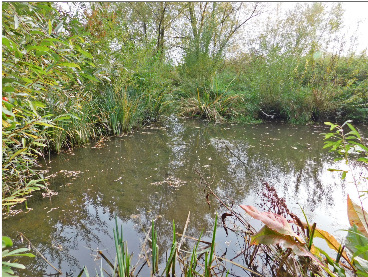
Foto 1: Altwasser am Mailinger Bach, das als Nahrungshabitat für Eisvögel dient

Bei einer Ortsbegehung des Umweltamts Ingolstadt wurde ein Grünspecht ( Picus viridis ) verhört. Im Auwald am Mailinger Bach wurden einige Spechthöhlen gefunden, die allerdings vom Bauvorhaben nicht beeinträchtigt werden. Im Eingriffsbereich sind weder Baumhöhlen noch geeignete Altbäume, in die Bruthöhlen gebaut werden können, vorhanden. Da das Betriebsgelände völlig frei von kurzrasigen Grünflächen ist, dient es für den Grünspecht auch nicht als Nahrungshabitat. Daher sind Verbotstatbestände gemäß § 44 (1) BNatSchG nicht erfüllt.