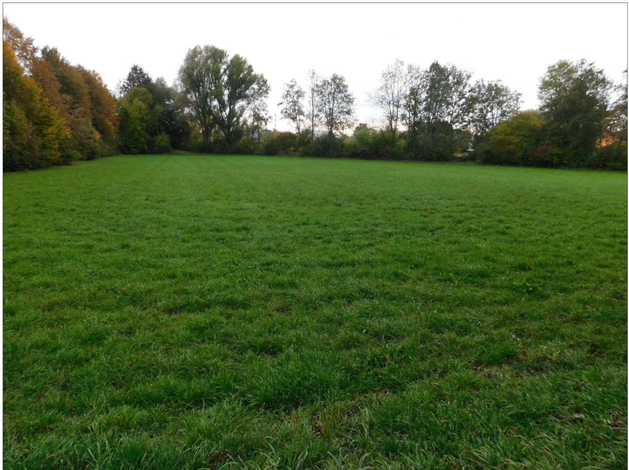
Foto 2: Ausgleichsfläche auf Fl.-Nr. 947, Gemarkung Mailing, von Nord nach Süd

Im nördlichen Zentrum ist Sumpf-Segge ( Carex acutiformis ) häufig, ohne dass dieser Bereich einen Schutzstatus nach § 30 BNatSchG besitzt. Für einen gesetzlichen Schutz sind zu wenige relevante Nasswiesenarten vorhanden. Neben Sumpf-Segge wachsen hier auch häufiger Wiesen-Flockenblume ( Centaurea jacea ) und zerstreut Kohl-Distel ( Cirsium oleraceum ). Am höher gelegenen Nordrand bestehen auf wenigen Quadratmetern Anklänge an eine Silgen-Wiese ( Sanguisorbo officinalis -Silaetum silai). Zerstreut wächst hier Großer Wiesenknopf ( Sanguisorba officinalis ) und sehr selten Wiesen-Silge ( Silaum silaus ). Im äußersten Nordwesten, an der tiefsten Stelle ist Rohrglanzgras ( Phalaris arundinacea ) in Bachnähe beigemischt.