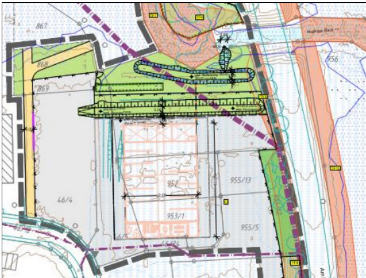
Abbildung 1: Lage der geplanten Halle (Lageplan WipflerPLAN 02.04.2024)

Die Firma Oblinger Recycling GmbH & CO.KG plant auf dem Betriebsgelände in 85055 Ingolstadt, am Mailinger Bach, Gemarkung Mailing, Fl.-Nr. 953/1, 952, 950 und 46/5 den Neubau einer Halle zur Lagerung von nicht gefährlichen Stoffen, wie z.B. Holz, Aushub, Bauschutt, Papier, Glas oder Rigips. Die Lage geht aus Abb. 1 hervor.