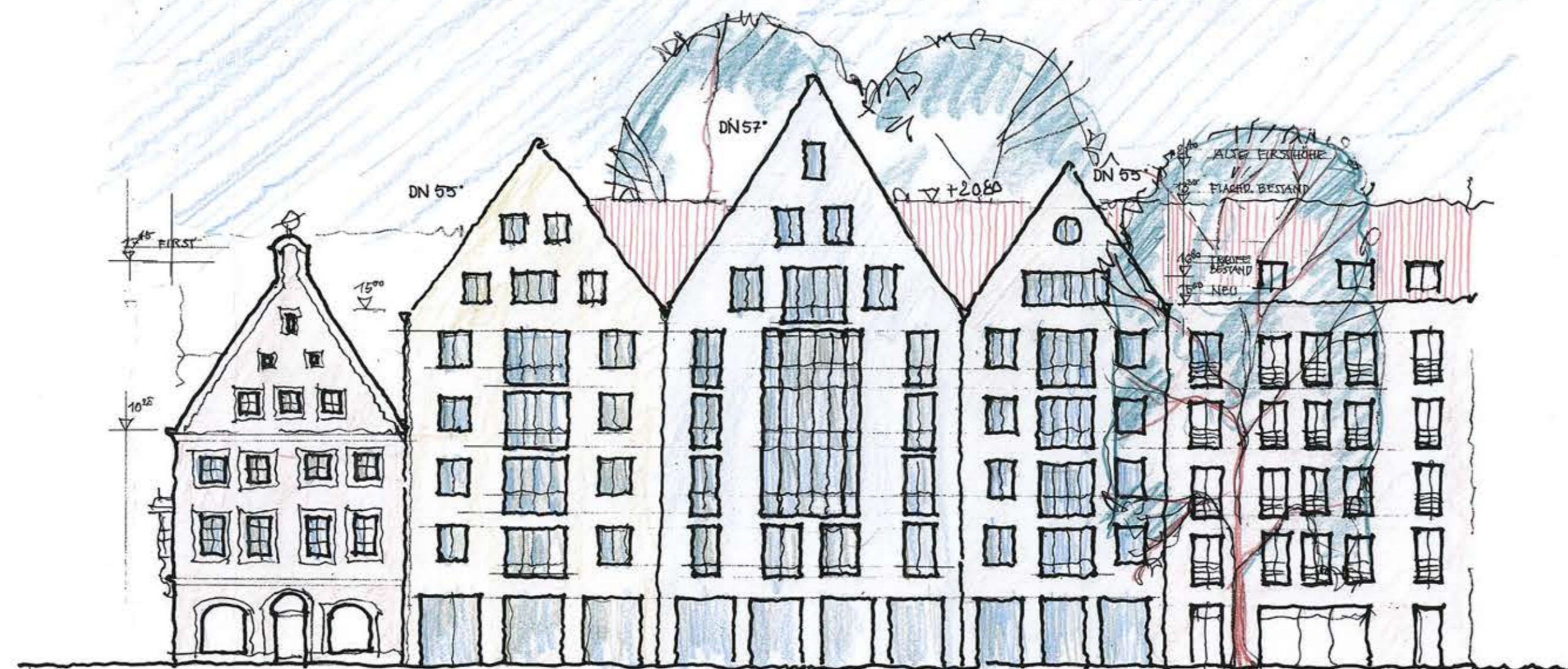
VARIANTE DONAUSTRASSE VARIANTE 2 MST.: 1:200