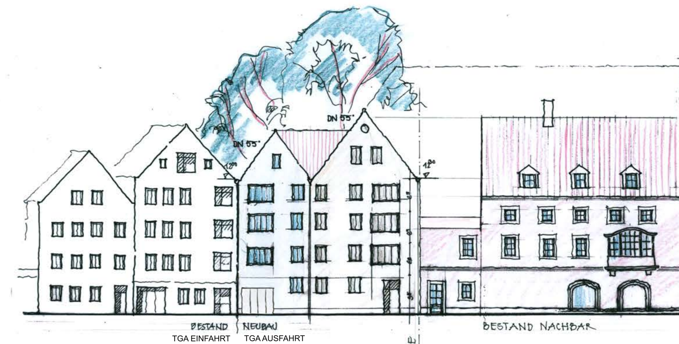
ANSICHT MÜNZBERGSTRASSE MST.: 1:200