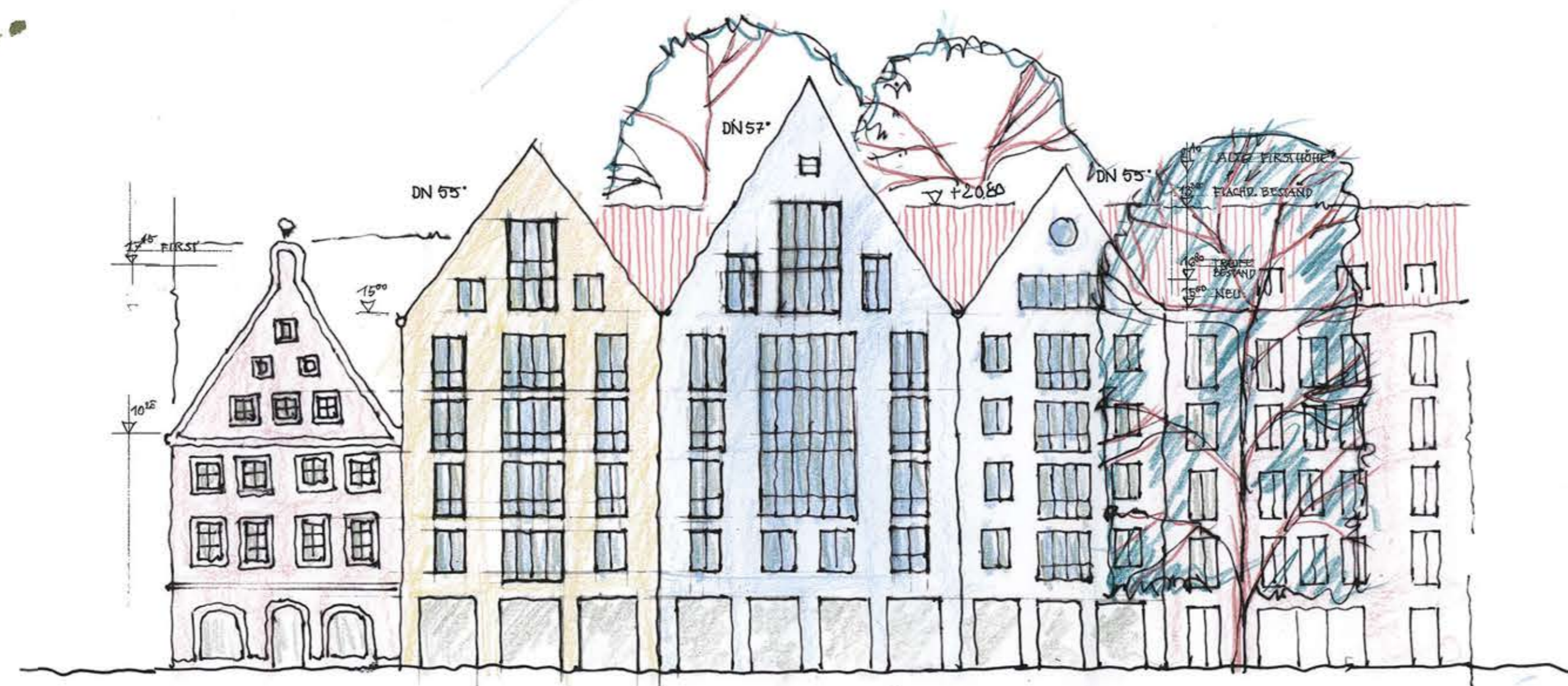
ANSICHT DONAUSTRASSE VARIANTE 1 MST.: 1:200