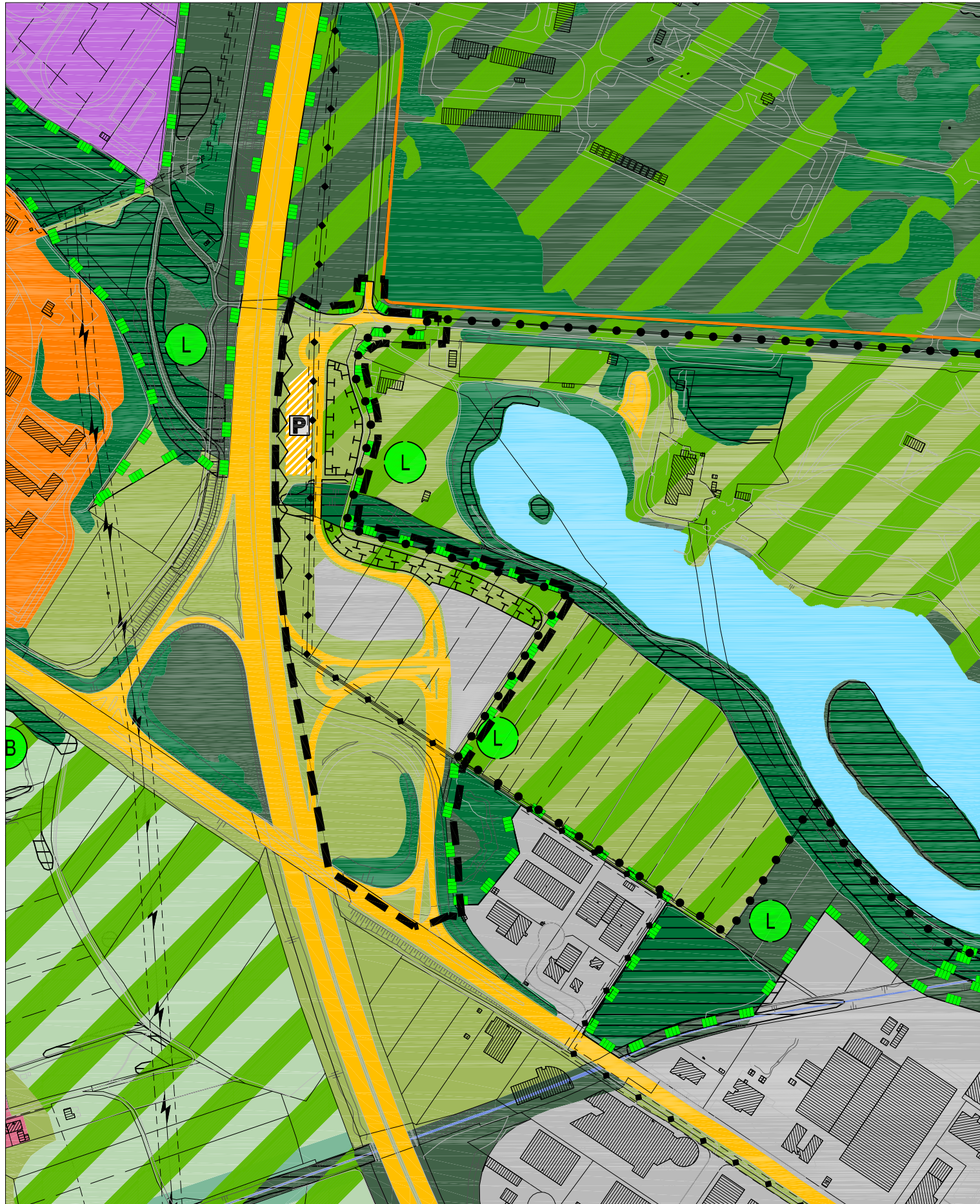
Änderung M 1:5000